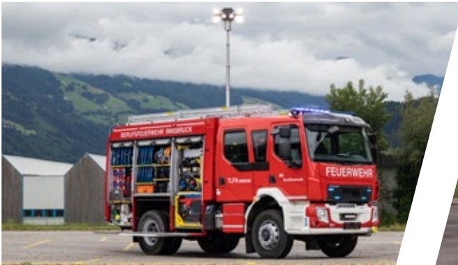
Tanklöschfahrzeug, TLF-A 2000 Pumper 2000