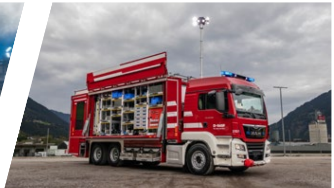
Rüstwagen mit Seiten- und Hecklift, RW Rescue Vehicle with side and rear lift