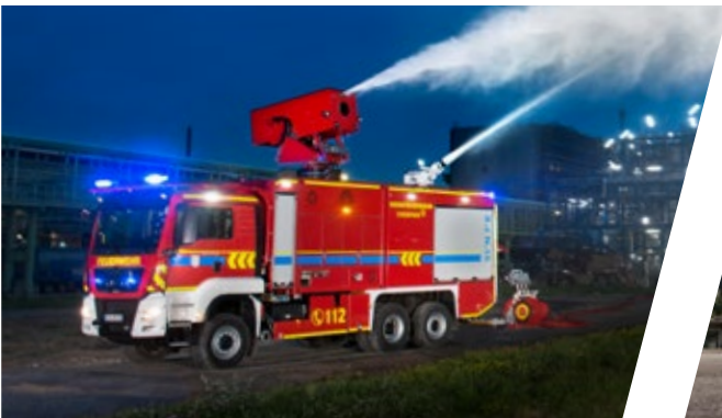
Turbinenuniversallöschfahrzeug, TULF Hydro Jet Fire Fighting Vehicle