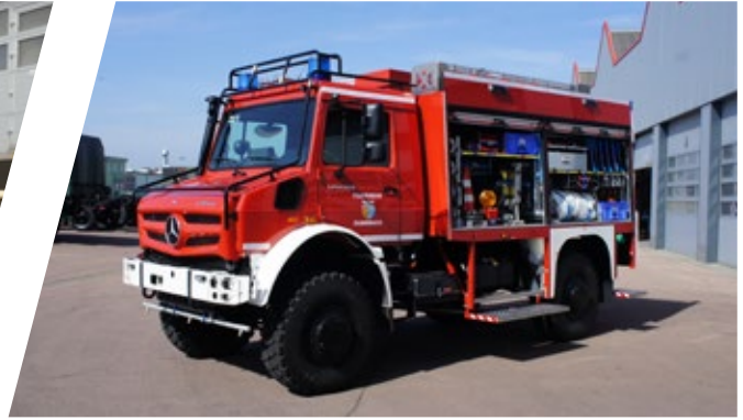
Tanklöschfahrzeug, TLF 2000 Pumper 2000