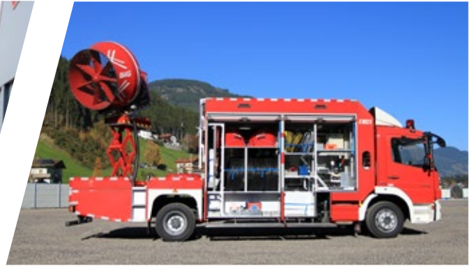
Großlüftfahrzeug Ventilator Vehicle