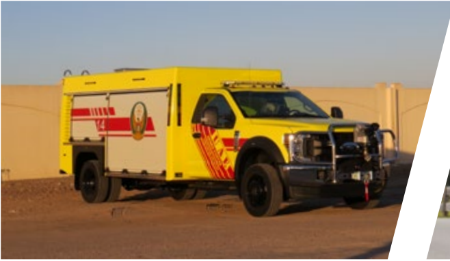
Schnellangriffsfahrzeug Rapid Intervention Vehicle, RIV