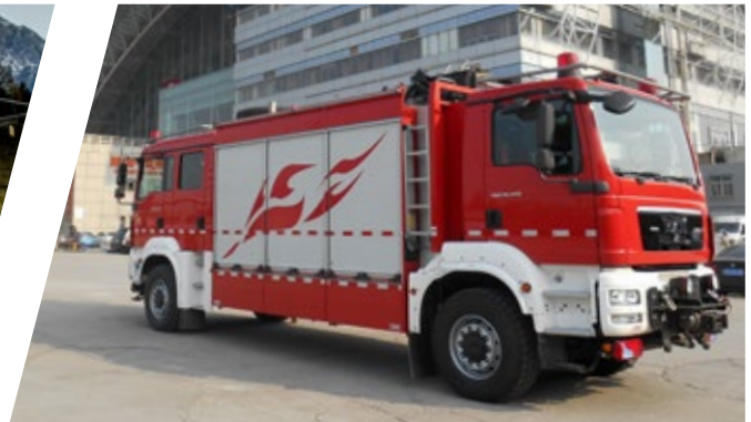
Tanklöschfahrzeug Double Head Pumper Double Head (Tunnel Extinguishing Vehicle)