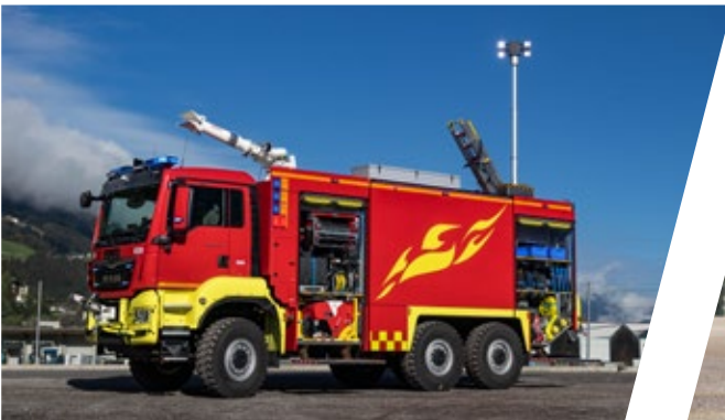
Flughafenlöschfahrzeug, FLF Airport Fire Fighting Vehicle