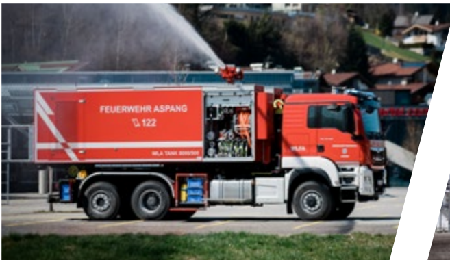
Wechseladefahrzeug, WLF Load Handling System