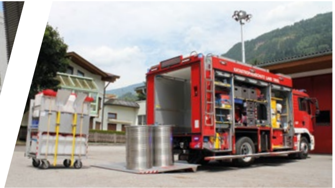
Gefährliche Stoffe Fahrzeug HAZMAT