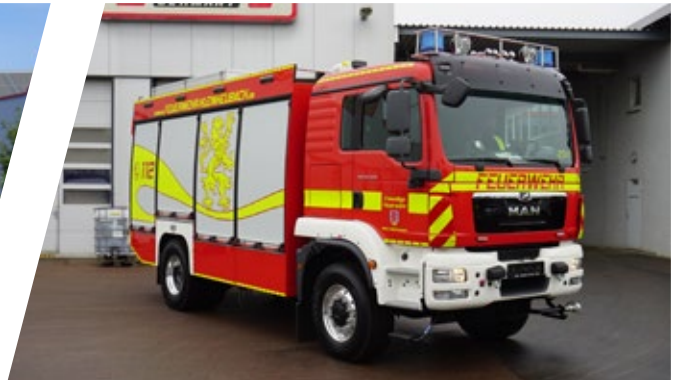
Tanklöschfahrzeug, TLF 4000 Pumper 4000