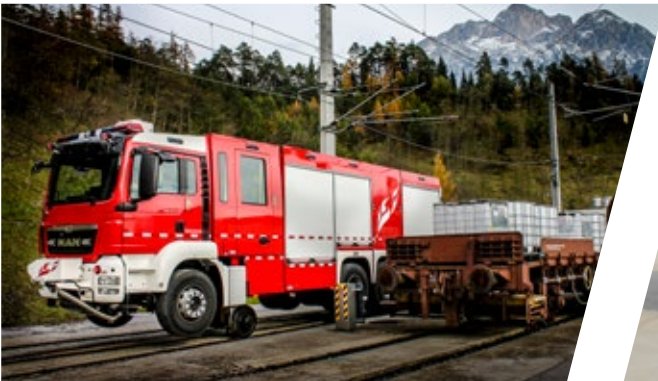
Zweiwegefahrzeug Two-way Vehicle