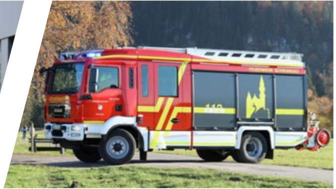
Hilfeleistungslöschgruppenfahrzeug PRIMUS, HLF 20 Rescue Pumper PRIMUS