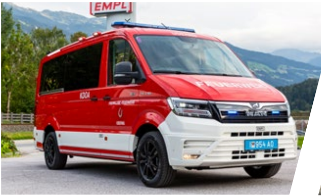
Kommandofahrzeug, KDO Command Vehicle