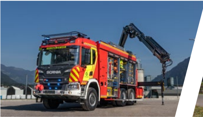
Gerätewagen mit Kran, GW-K Heavy Rescue Vehicle with crane