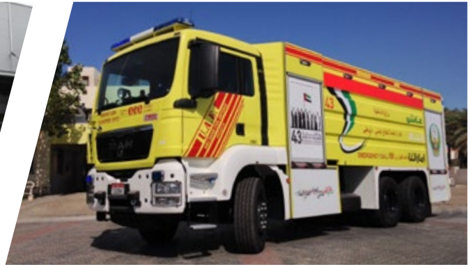
Tanklöschfahrzeug , TLF 14000 Pumper 14000