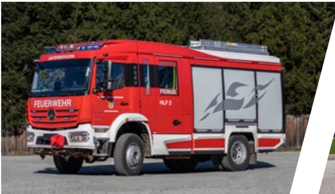
Hilfeleistungslöschgruppenfahrzeug PRIMUS, HLF 2 Rescue Pumper PRIMUS