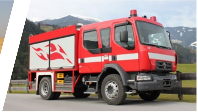
Tanklöschfahrzeug, TLF 1500/500 Pumper 1500/500