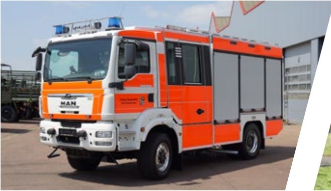
Löschgruppenfahrzeug für Katastrophenschutz, LF 20 Kat Pumper for civil protection