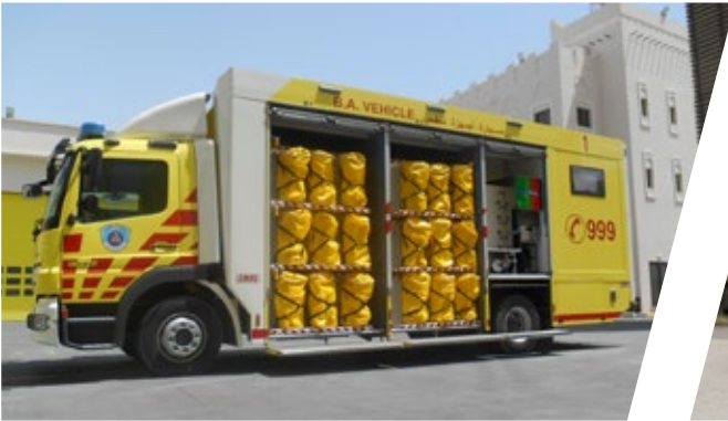
Atemschutzfahrzeug Breathing Apparatus Vehicle