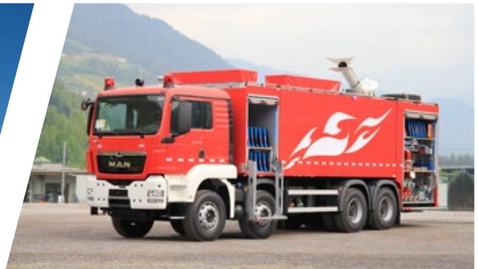
Tanklöschfahrzeug, TLF 20000 Pumper 20000