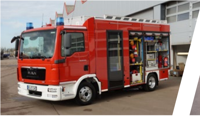
Mittleres Löschfahrzeug, MLF Medium Fire Fighting Vehicle