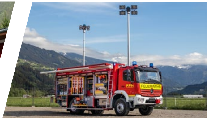
Rüstwagen, RW Rescue Vehicle