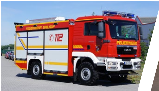
Tanklöschfahrzeug, TLF 3000 Pumper 3000