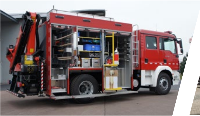
Rüstwagen mit Kran, RW-K Rescue Vehicle with crane