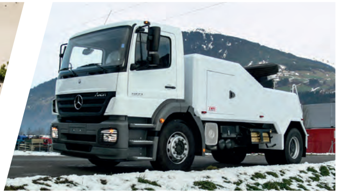
Bergefahrzeug EH/W 100 Medium Recovery Vehicle EH/W 100