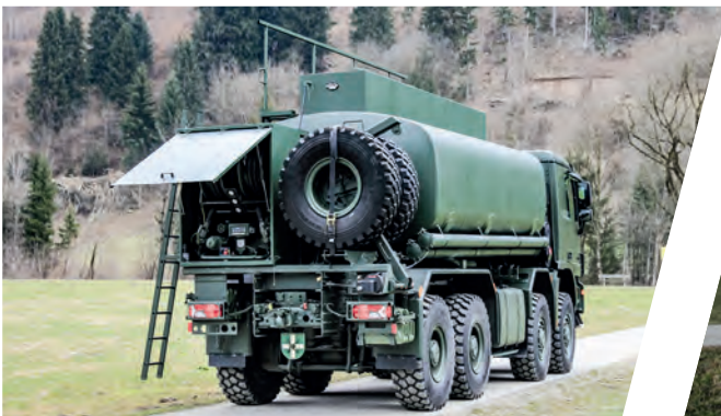
Treibstofftank 18.000 l Fuel Tank Body 18.000 l