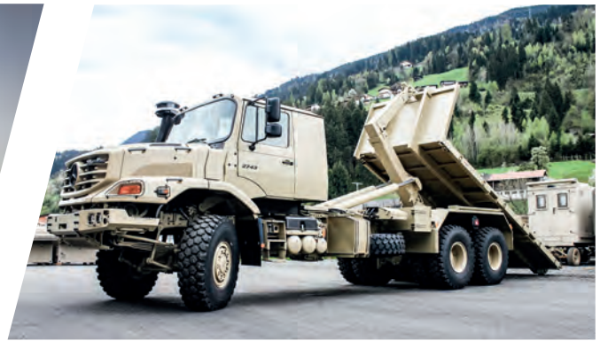
Hakenladesystem mit Flat Rack Load Handling system with Flat Rack