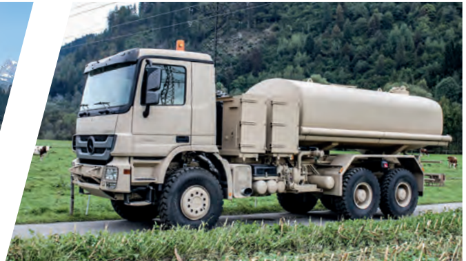
Wassertank 13.500 l Water Tank Body 13.500 l