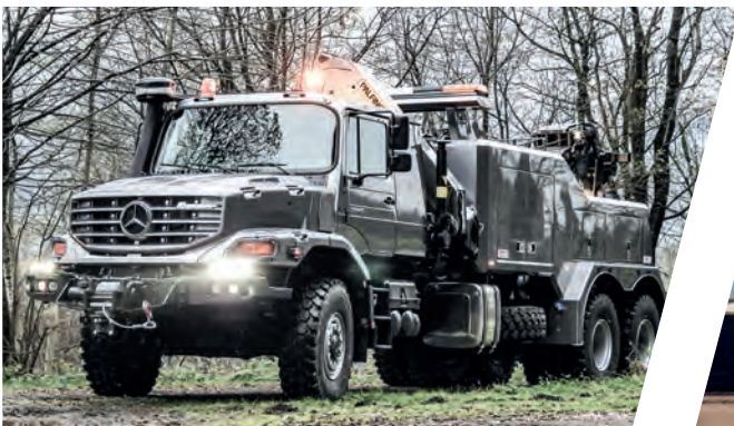
Schweres Bergefahrzeug EH/W 200 Bison mit Kran Heavy Duty Recovery Vehicle EH/W 200 Bison with crane