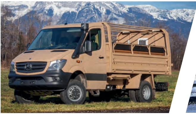
Truppentransporter Troop Carrier