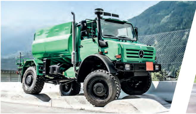
Geländegängiger Wassertank 5.000 l All terrain Water Tank Body 5.000 l