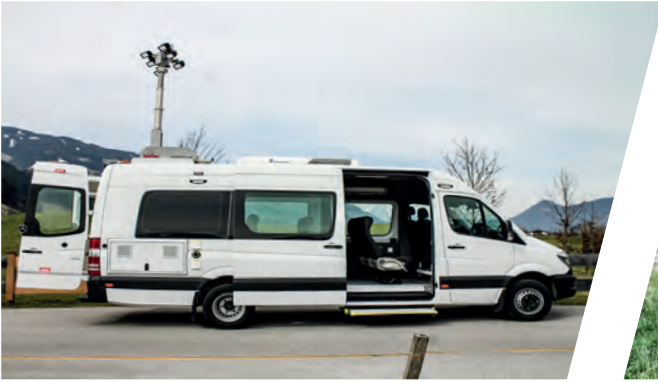
EOD-Fahrzeug Screening Van