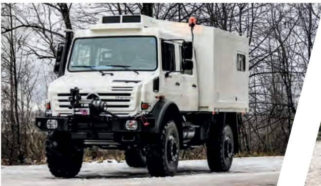
Buskoffer mit Überrollschutzsystem Body with Roll Over Protection System