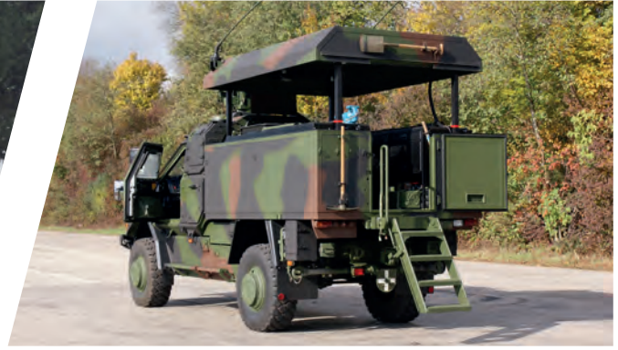
Mobile Werkstatt mit elektrischem Hubdach Mobile Service with Lifting Roof