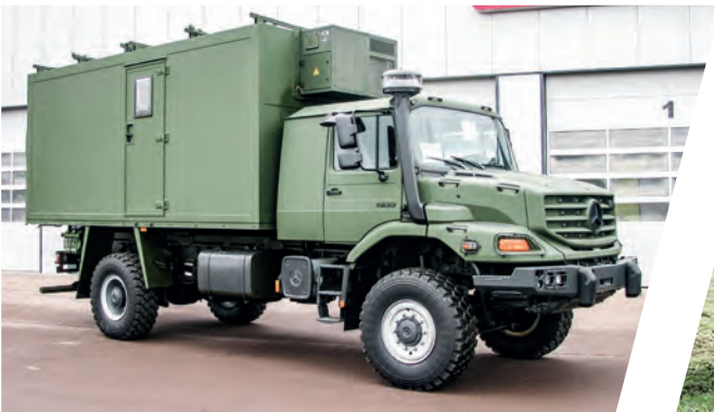
Funk-Shelter Radio Vehicle