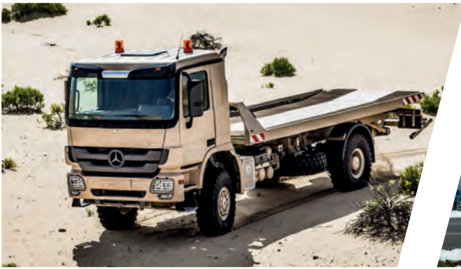
Schiebeplateau Sliding Platform