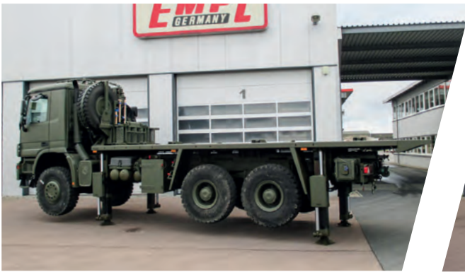
Nivelliersystem mit Pritsche und Rahmenwinde Stabilising Truck System with Cargo Body and frame winch