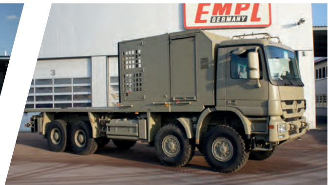
Nivelliersystem mit Pritsche und Staukästen Stabilising Truck System with Cargo Body and Storage Module