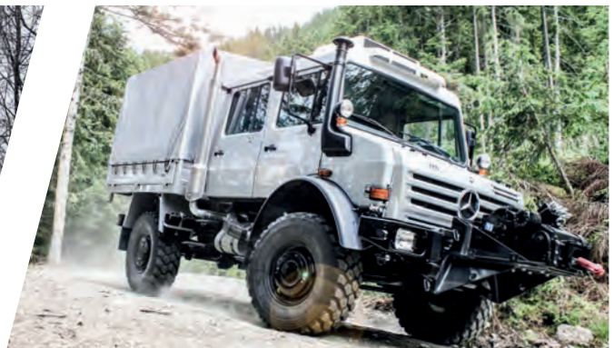
Truppentransporter, verwindungsfrei mit 10 to Winde Troop Carrier, torsion free with 10 to winch