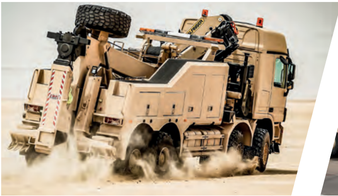
Schweres Bergefahrzeug EH/W 200 Bison mit Kran Heavy Duty Recovery Vehicle EH/W 200 Bison with crane