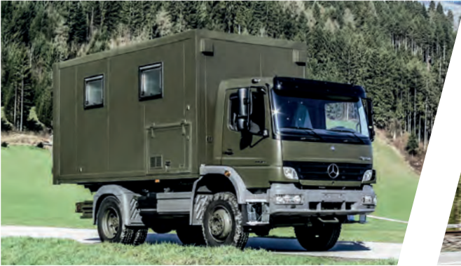
Mobile Werkstatt Mobile Workshop