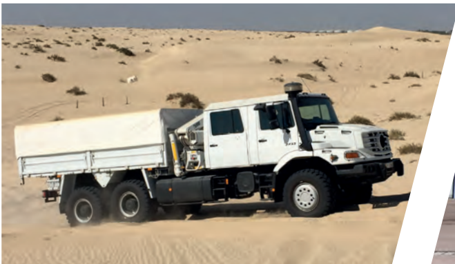
Pritsche mit Schieberverdeck und Kran Cargo Body with Sliding Tarpaulin and Crane