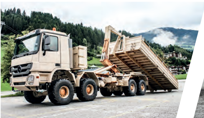
Hakenladesystem mit Flat Rack für Bergeinsätze Load Handling System with Flat Rack for Recovery Operation