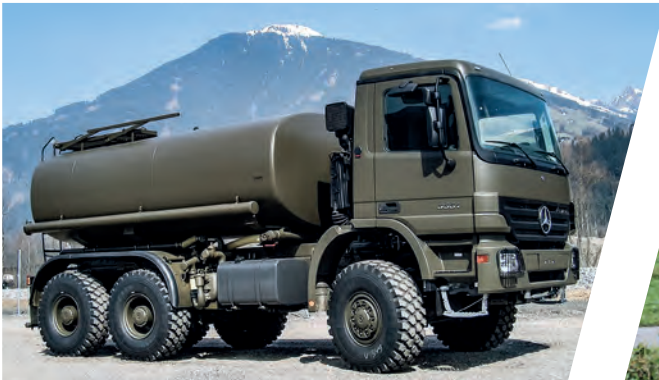
Treibstofftank 6.500 l Fuel Tank Body 6.500 l