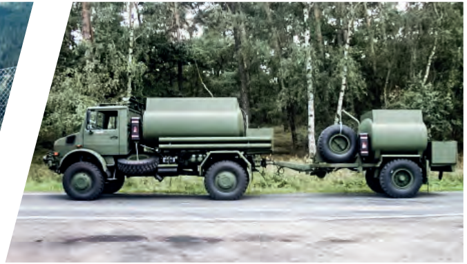
Geländegängiger Treibstofftank 5.000 l mit Anhänger 500 l All-terrain Fuel Tank Body 5.000 l with Trailer 500 l