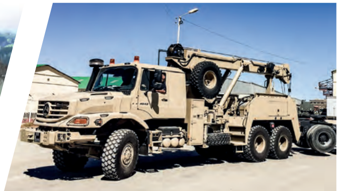
Bergekräne EH/TC 53.000 Recovery Cranes EH/TC 53.000