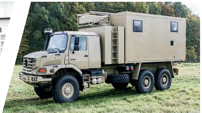
Mobile Waschküche Mobile Laundry