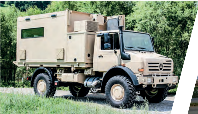
Kommando Shelter, verwindungsfreie Plattform Command and Control Shelter, torsion free platform