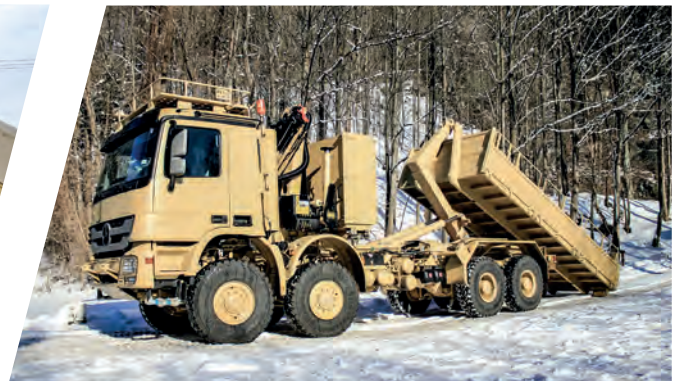
Hakenladesystem mit Flat Rack und Kran Load Handling System with Flat Rack and Crane