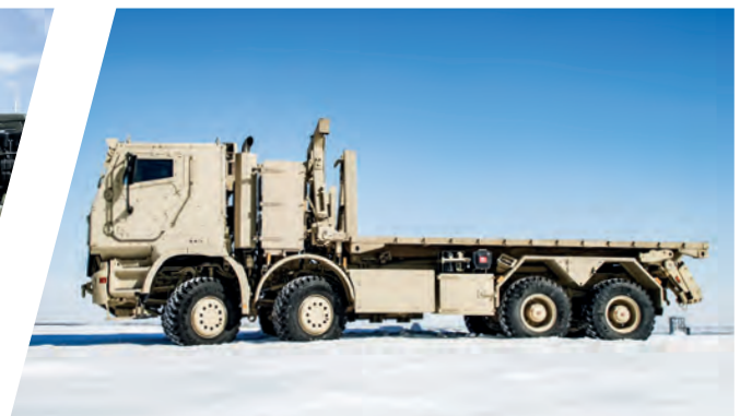
Hakenladesystem mit Flat Rack Load Handling System with Flat Rack