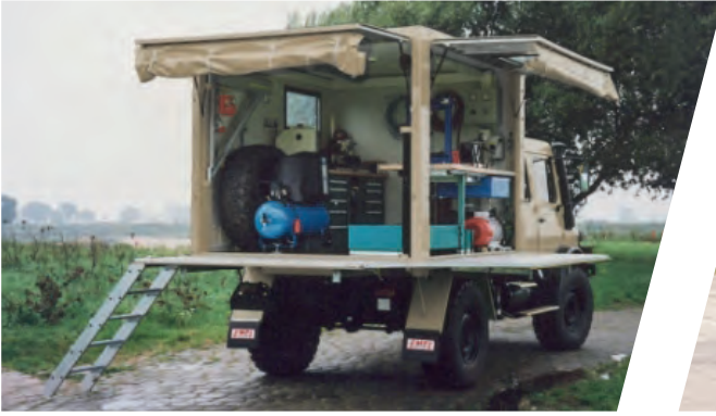
Mobile Werkstatt Mobile Workshop