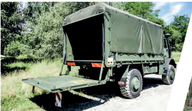
Wechselsystem mit integriertem Hecklift am Transportshelter Interchangeable Body System with body-integrated tail-lift