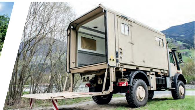
Wechselsystem mit integriertem Hecklift am Transportshelter Interchangeable Body System with body-integrated tail-lift