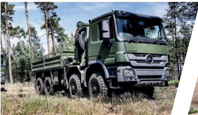
Pritsche für Materialtransport Cargo Body for material transporting