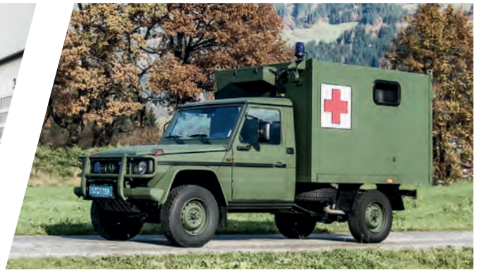
Geländegängiger Krankentransportwagen All-terrain Mobile Patient Transport Ambulance