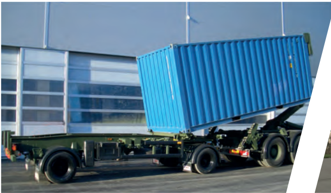
Schlittenanhänger Sliding Tray Trailer