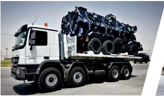
Hakenladesystem mit Flat Rack Load Handling System with Flat Rack