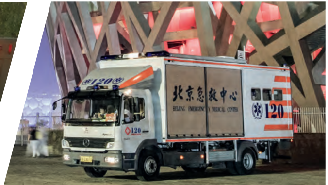
Kombinierter Notarzt- und Einsatzwagen Combined Emergency Doctor and Rescue Vehicle