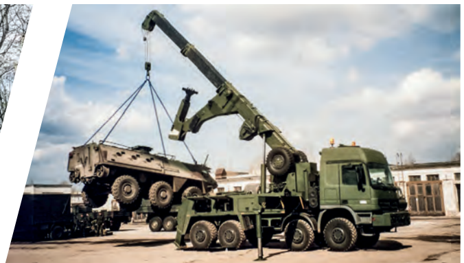
Schweres Bergefahrzeug EH/W 200 SBV Heavy Duty Recovery Vehicle EH/W 200 SBV