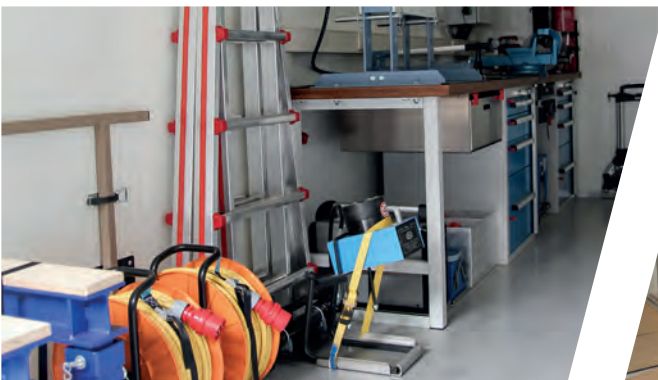
Inneneinrichtung Mobile Werkstatt Interior Mobile Workshop