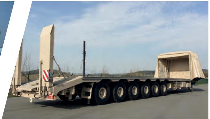
6-achs Tieflader, 70 t Nutzlast 6-axle Low Bed Semi Trailer, 70 t payload