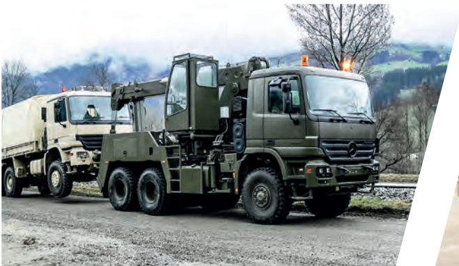
Bergekräne EH/TC 53.000 Recovery Cranes EH/TC 53.000