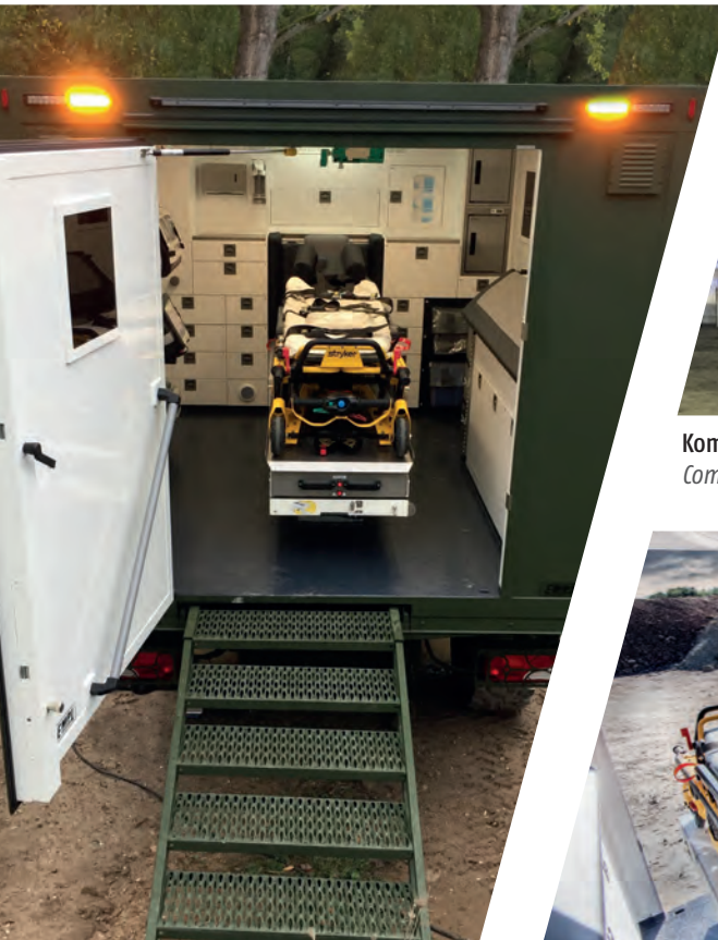
Inneneinrichtung Mobiler Notarztwagen Interior Mobile Emergency Doctor Vehicle