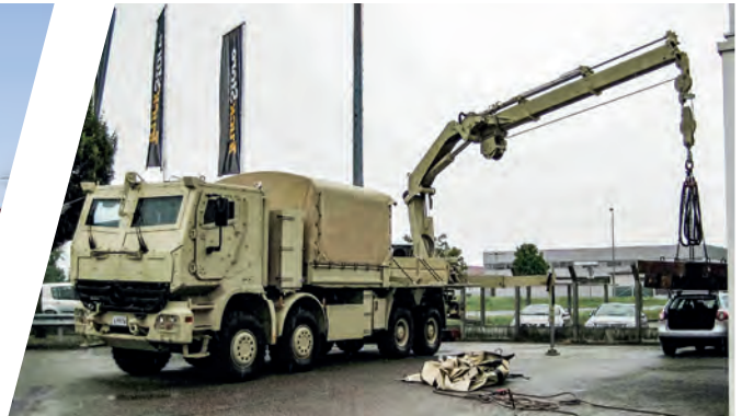
Mobile Werkstatt, verwindungsfreie Plattform Mobile Workshop, torsion free platform