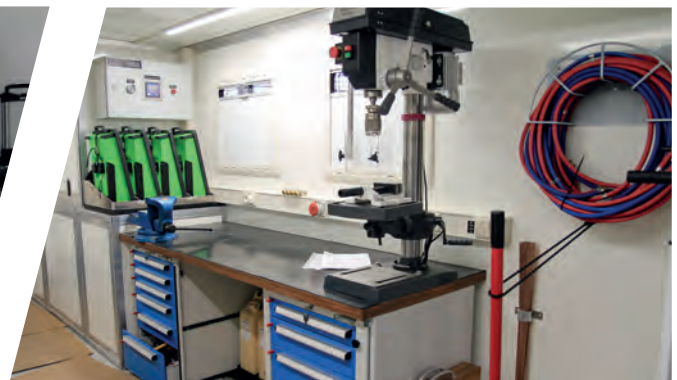
Inneneinrichtung Mobile Werkstatt Interior Mobile Workshop