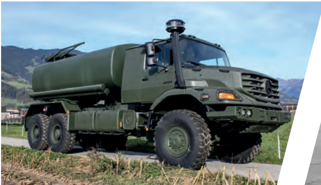
Treibstofftank 14.000 l Fuel Tank Body 14.000 l