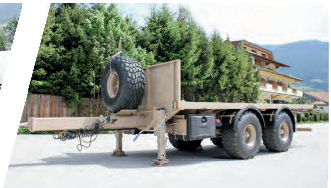
Zentral-Achs-Anhänger Tandem Trailer