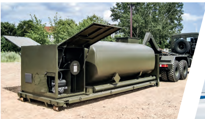
Hakenladesystem mit Hubschrauberbetankungs-System Load Handling System with Helicopter Refueling System