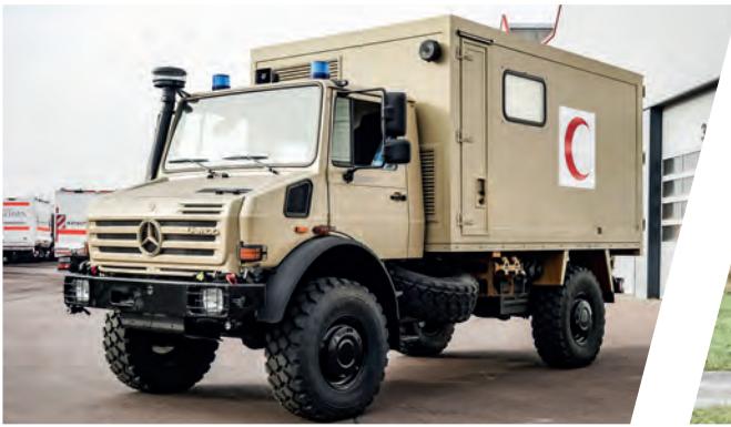
Geländegängiger Krankentransportwagen All-terrain Mobile Patient Transport Ambulance