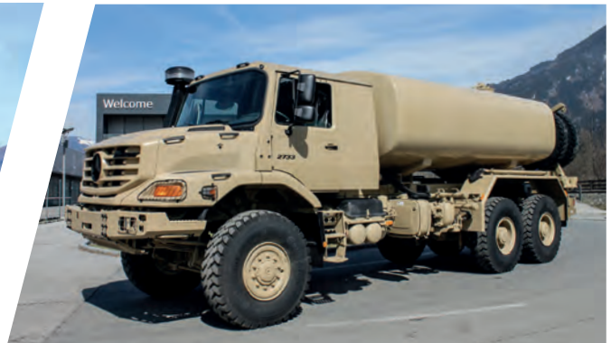
Treibstofftank 14.000 l Fuel Tank Body 14.000 l