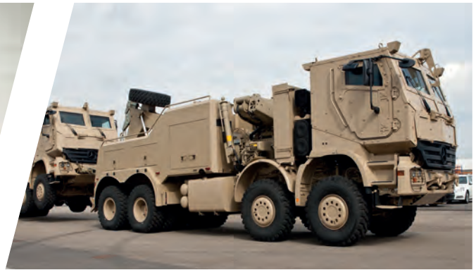
Schweres Bergefahrzeug EH/W 200 Bison mit Kran Heavy Duty Recovery Vehicle EH/W 200 Bison with crane