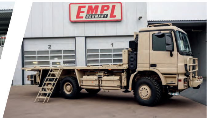
Nivelliersystem mit Pritsche und abnehmbarer Frontwinde Stabilising Truck System with Cargo Body and removeable front winch