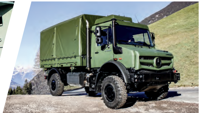
Wechselsystem mit Truppentransporter Interchangeable Body System with Troop Carrier