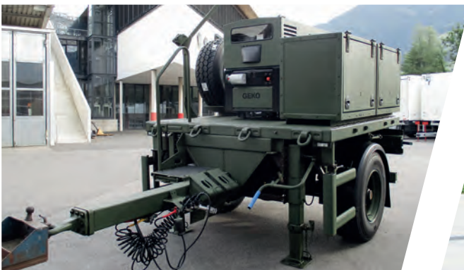
Generator-Anhänger Generator Trailer