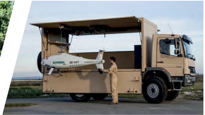
Drohnentransporter Drones Transporting Body