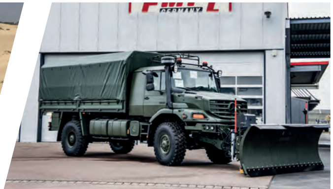
Pritsche mit Plane und Schneeräumer Cargo Body with Tarpaulin and Snow Plow