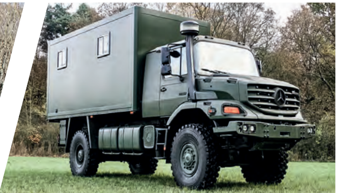
Gefangenentransporter Prisoner Transport Vehicle