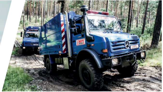
Rüstfahrzeug mit Rettungs- und Detektionsequipment Rescue Vehicle with Detection Equipment