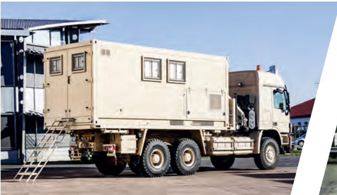
Ersatzteil-Shelter, wechselbar auf verwindungsfreier Plattform Spare Parts Shelter, interchangeable on torsion free platform