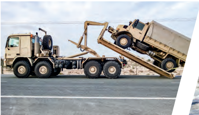
Hakenladesystem mit Flat Rack für Bergeinsätze Load Handling System with Flat Rack for Recovery Operation