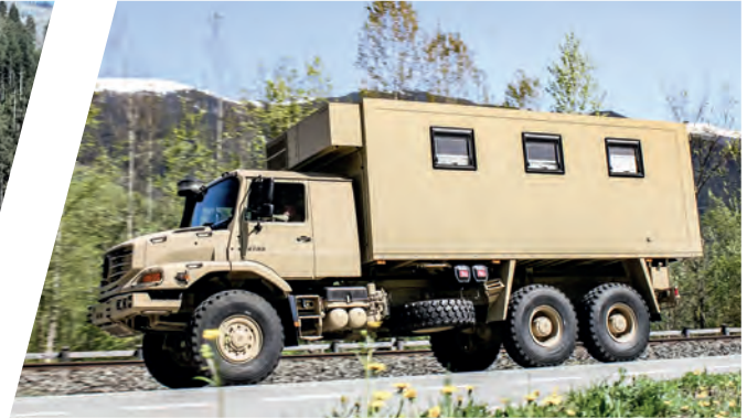
Mobile Werkstatt Mobile Workshop