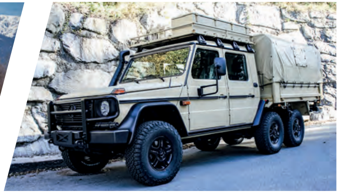
Truppentransporter Troop Carrier