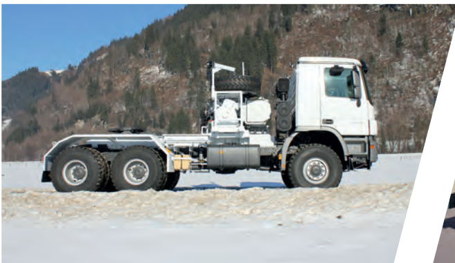
Sattelzugmaschinen mit Doppelwinden Tractor Head Equipment with Double Winching System