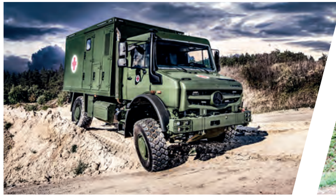
Geländegängiger Notarztwagen All-terrain Mobile Emergency Doctor Ambulance