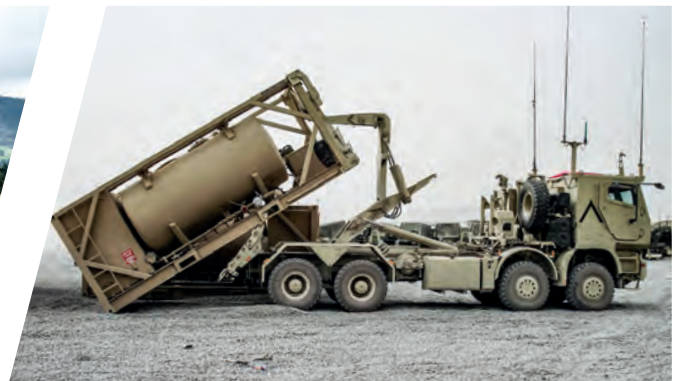
Hakenladesystem mit ISO-Treibstofftank Load Handling System with ISO Fuel Pod