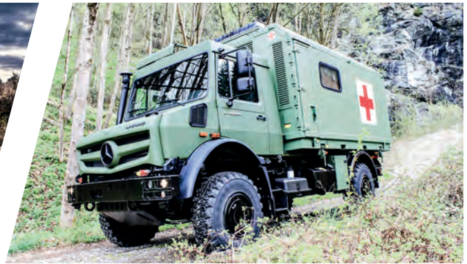
Geländegängiger Notarztwagen All-terrain Mobile Emergency Doctor Ambulance