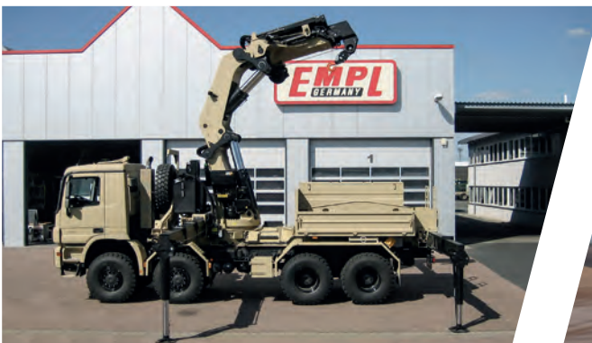
150 mto Kran mit Ballastpritsche 150 mto Crane with Ballast Cargo Body