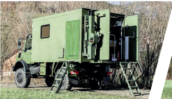
Funk-Shelter Radio Vehicle