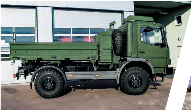
Wechselsystem mit Pritsche Interchangeable Body System with Cargo Body