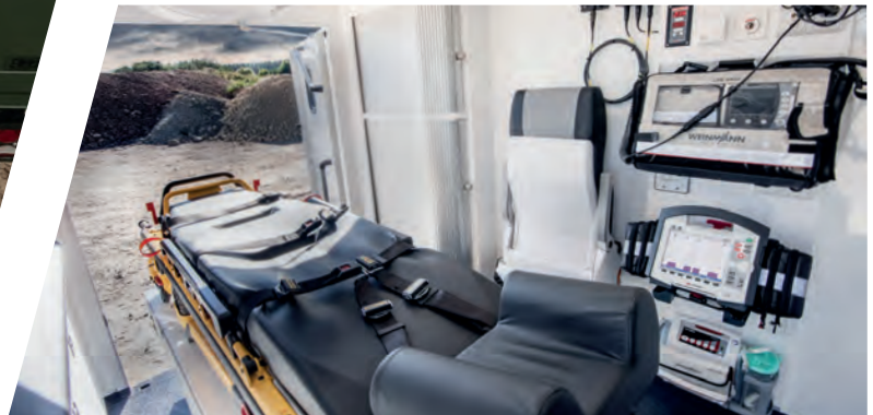
Inneneinrichtung Mobiler Notarztwagen Interior Mobile Emergency Doctor Vehicle