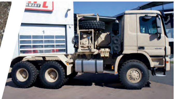
Sattelzugmaschinen mit Doppelwinden Tractor Head Equipment with Double Winching System