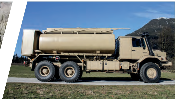
Öltank 14.000 l Oil Tank Body 14.000 l