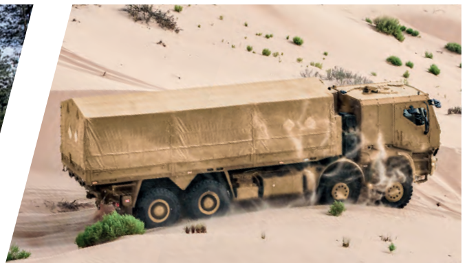
Pritsche für Containertransport, verwindungsfrei Troop Carrier for container transporting, torsion free