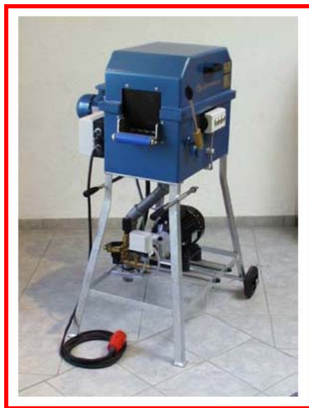
Schlauchwaschmaschine SW 110/HD mit zusätzlicher Hochdruckeinrichtung

Fahrbare Schlauchwaschmaschine SW 110/HD zum Reinigen von einem Feuerwehrschauch der Größe D-C-B-A bestehend aus: