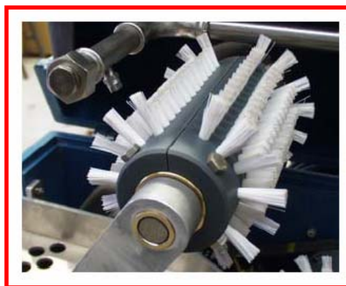
Geteilte Bürstenhalbschalen für leichten Bürstenwechsel und optimale Wartung