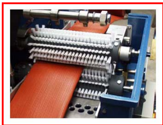
Kurze, harten Borsten ermöglichen eine optimale Reinigung und lange Lebensdauer.