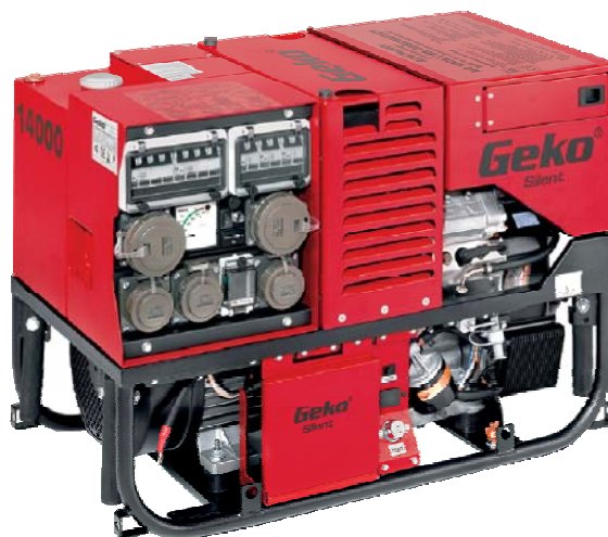
Stromerzeuger Geko 14000 ED-S/SEBA DIN 14685