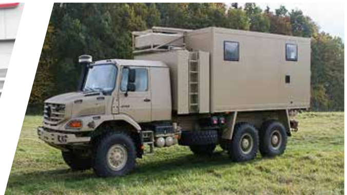
Superstructure-buanderie Carrocería de lavandería