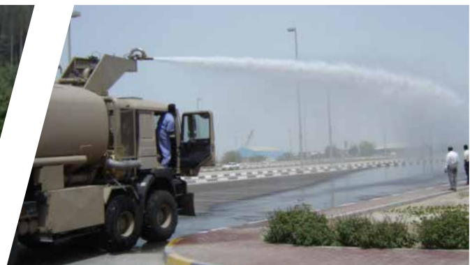
Véhicule anti-émeute Vehículo antidisturbios