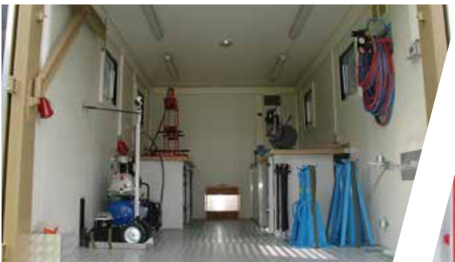
Aménagement intérieur d'atelier mobile Equipamiento interior del taller móvil