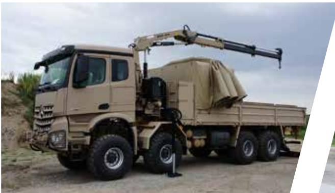
Plateau avec bâche coulissante et grue Plataforma con lona corrediza y grúa