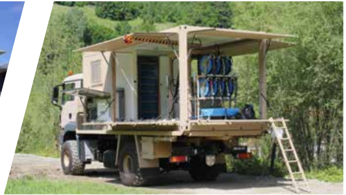
Superstructure pour service de lubrification, interchangeable Carrocería de taller de lubricación, intercambiable