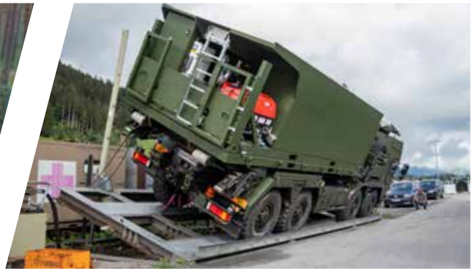
Test de basculement statique Ensayo de vuelco estático