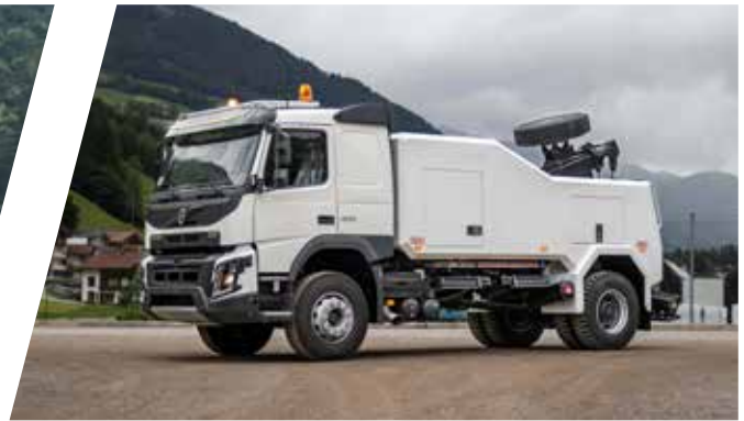
Dépanneuse EH/W 150 Vehículo de rescate EH/W 150