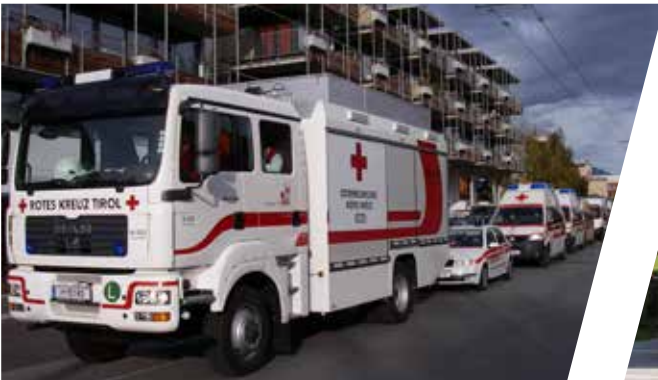
Véhicule pour accident majeur Vehículo médico para accidentes de gran envergadura