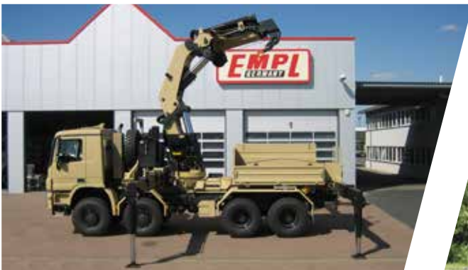
Grue 150 mto avec plateau de lestage Grúa de 150 t con plataforma de lastre