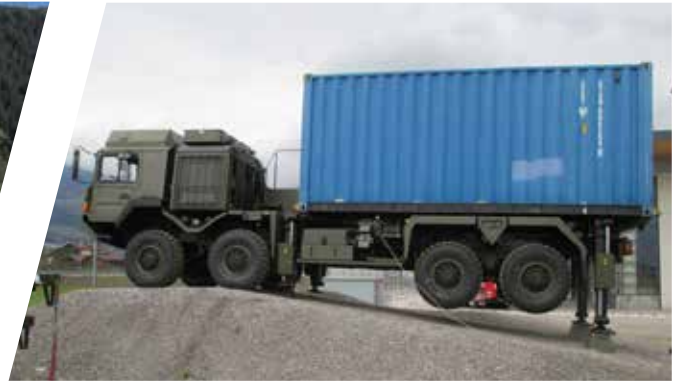
Système de nivellement Sistema de nivelación