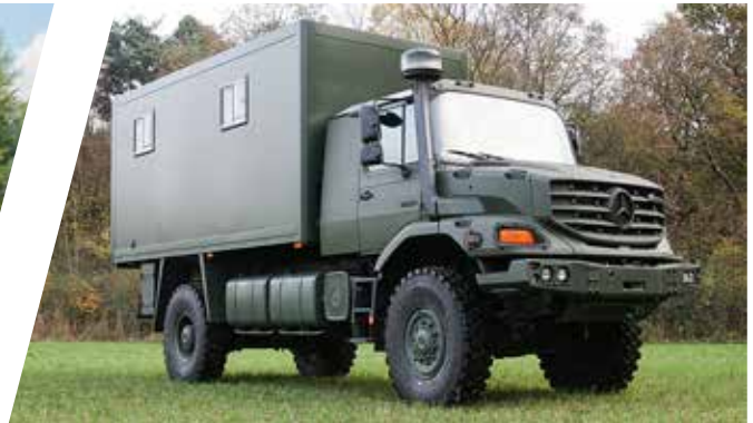
Transporteur de prisonniers Transporte de prisioneros