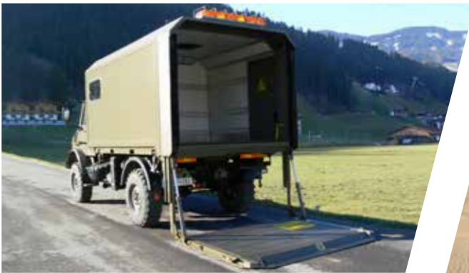
Superstructure interchangeable - caisse avec hayon élévateur Caja intercambiable con plataforma hidráulica