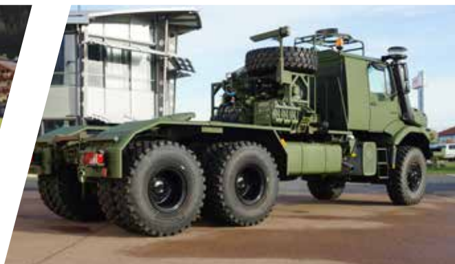
Équipement de tracteur routier Equipamiento de cabeza tractora