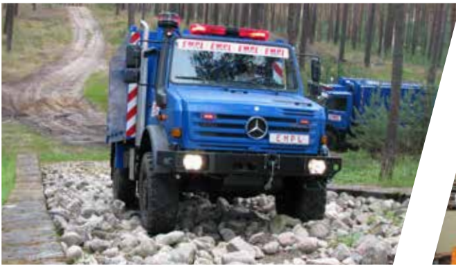
Contrôle du véhicule sur une pente d'éboulis meuble Ensayo del vehículo en una pendiente de cantos rodados sueltos