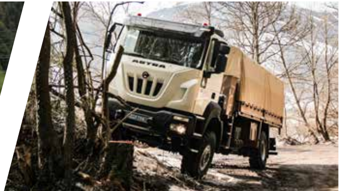
Transport de troupes avec banquettes latérales rabattables Vehículo de transporte de tropas con bancos de asientos laterales plegables