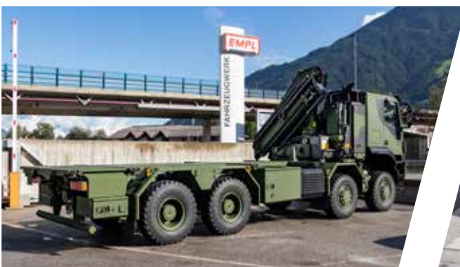
Cadre de conteneur avec grue et treuil Chasis portacontenedores con grúa y cabrestante