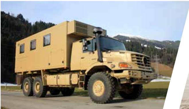
Atelier mobile Taller móvil