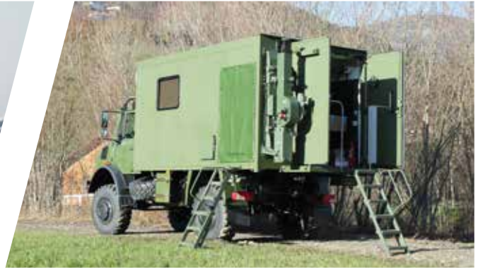
Superstructure de commandement Carrocería de puesto de mando