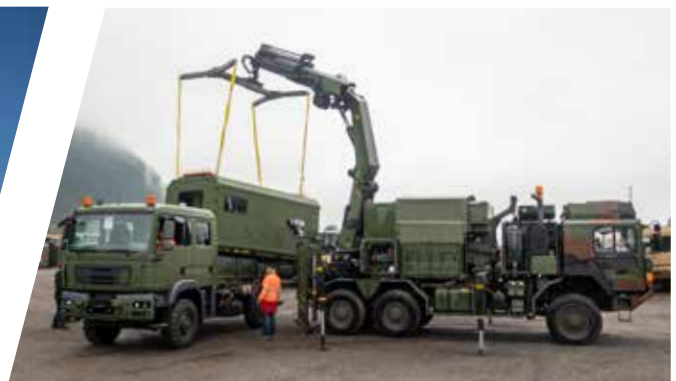
Contrôle du système interchangeable Comprobación de las carrocerías intercambiables