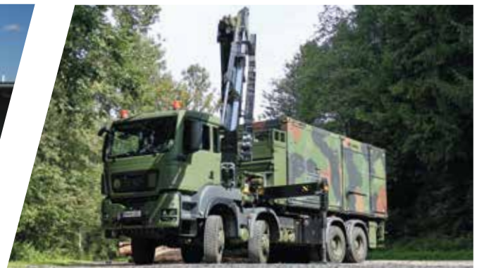
Superstructure pour modules de décontamination Carrocería de sistema para módulo de descontaminación