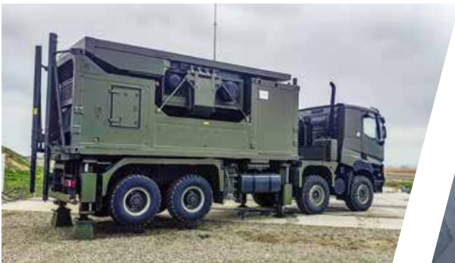
Système de nivellement Sistema de nivelación