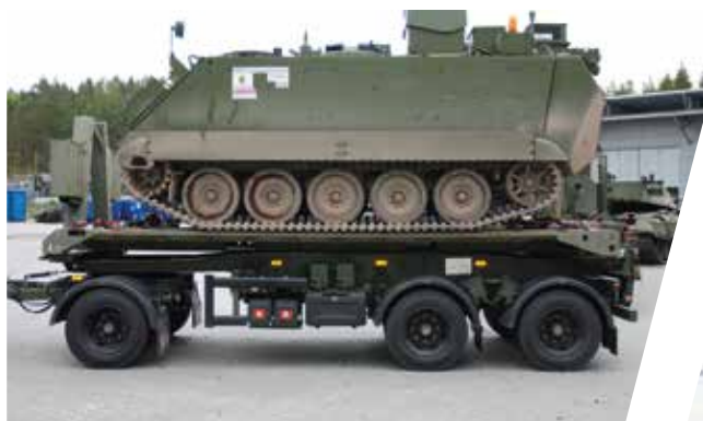
Remorque à plateforme coulissante Remolque con plataforma deslizante

Además, existe la posibilidad de dotar a las cabezas tractoras de equipamiento completo, incluidos los cabrestantes, acoplamientos de quinta rueda y todos los accesorios.