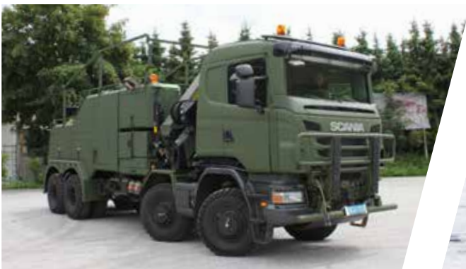
Dépanneuse EH/W 200 Bison avec grue Vehículo de rescate EH/W 200 Bison con grúa