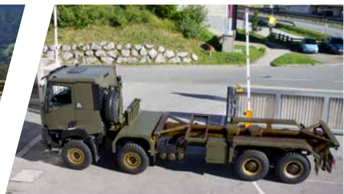
Cadre de conteneur Chasis portacontenedores