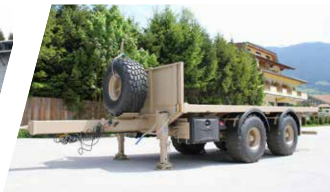
Remorque à axe central Remolque de eje central