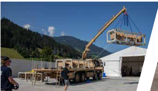
Test de grue Ensayo de la grúa