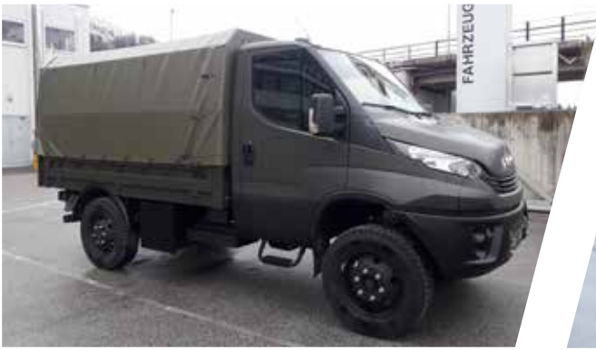
Transport de troupes avec hayon et sièges individuels Vehículo de transporte de tropas con puerta trasera y asientos individuales