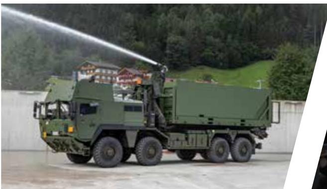
Système de chargement à crochet avec conteneur d'extinction Sistema de gancho de carga con contenedor de extinción de incendios