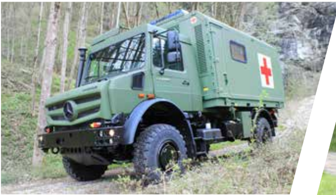
Unité mobile hospitalière tout-terrain Ambulancia de emergencia todoterreno