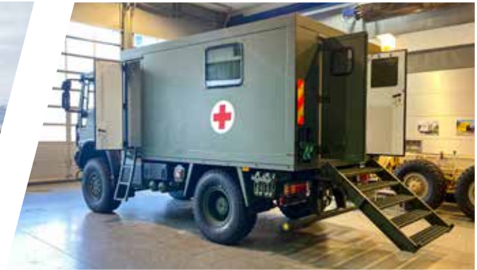
Unité mobile hospitalière tout-terrain Ambulancia de emergencia todoterreno