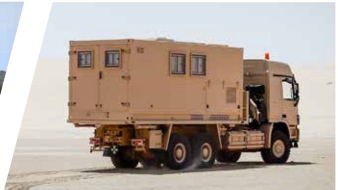
Superstructure d'atelier mobile, interchangeable Carrocería de taller móvil, intercambiable