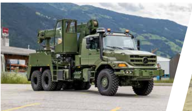
Dépanneuse-grue lourde EH/TC Vehículo de rescate pesado EH/TC con grúa