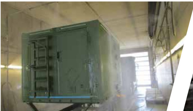
Test d'étanchéité / test de pluie Ensayo de estanqueidad / ensayo de lluvia