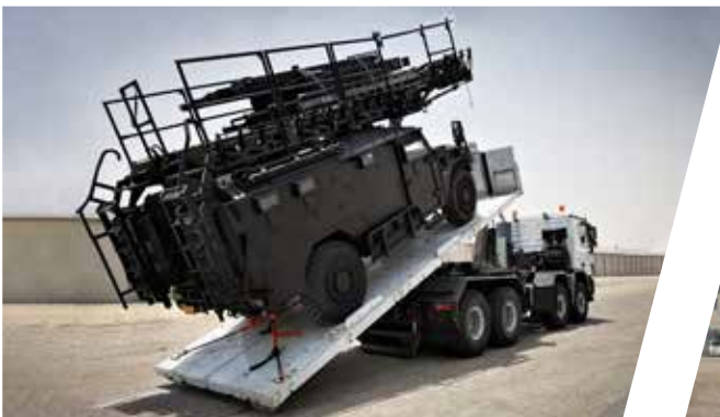
Bras de manutention à crochet avec plateforme de transport Sistema de gancho con bastidor plano