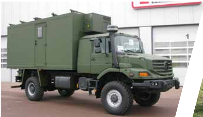
Véhicule de communication radio Shelter de radio