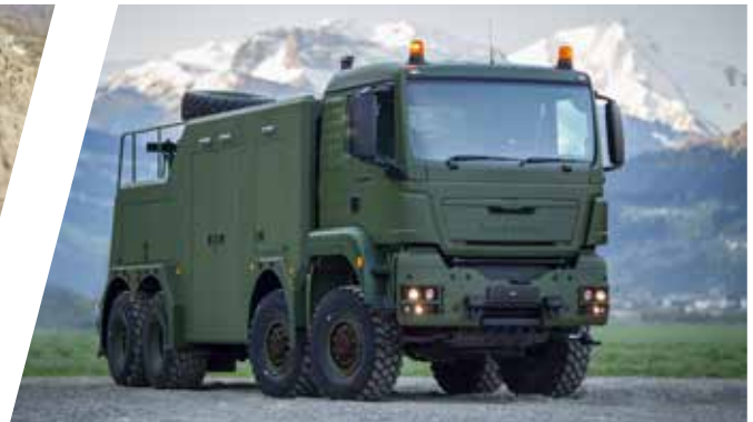
Dépanneuse EH/W 200 Bison Vehículo de rescate EH/W 200 Bison