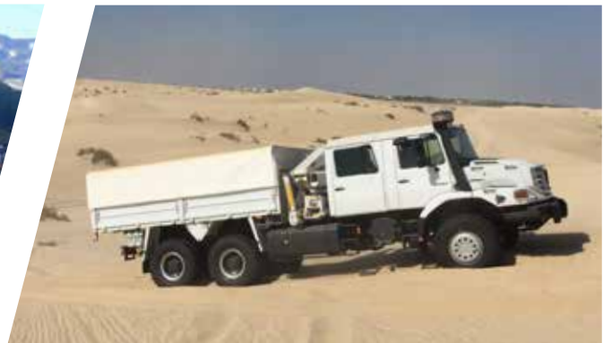
Plateau avec bâche coulissante et grue Plataforma con lona corrediza y grúa