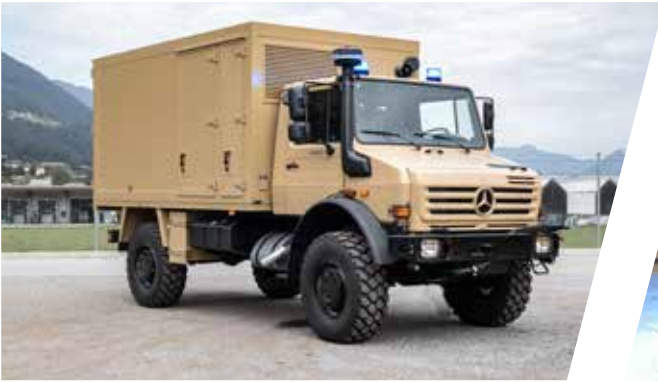
Unité mobile hospitalière tout-terrain Ambulancia de emergencia todoterreno