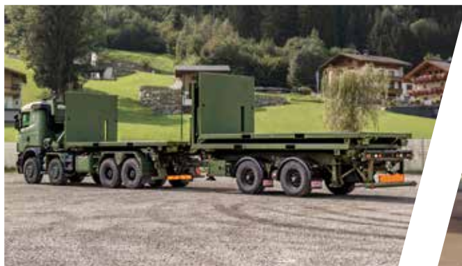
Système de chargement à crochet avec remorque à essieu central et plateaux droits Sistema de gancho de carga con remolque de eje central y bastidor plano