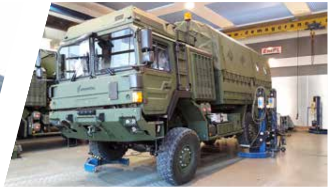
Torsion diagonale statique Ensayo de torsión estático