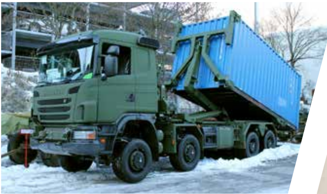
Bras de manutention à crochet avec CHU Sistema de gancho con CHU