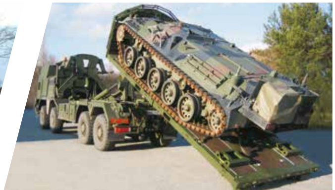
Bras de manutention à crochet avec CHU et plateforme de transport Sistema de gancho con CHU y bastidor plano