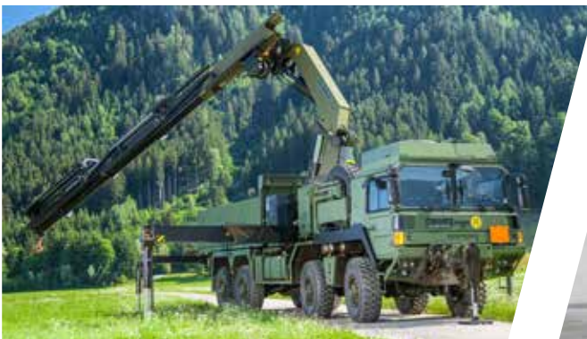
Plateau avec grue Plataforma con grúa