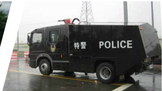
Véhicule anti-émeute Vehículo antidisturbios