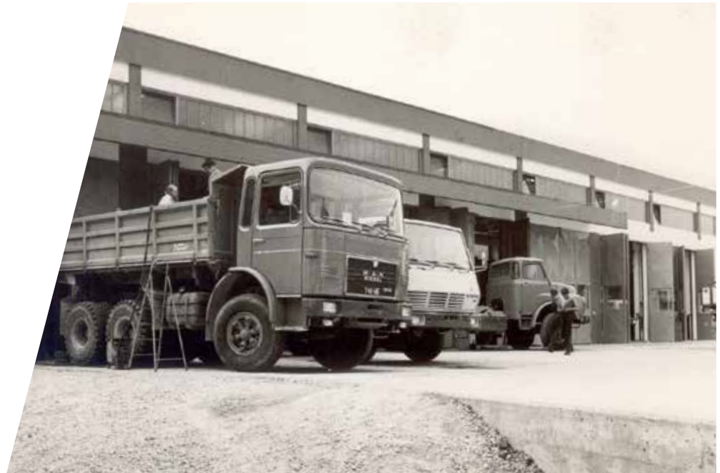
Ancienne usine à Kaltenbach en 1970 Antigua planta de Kaltenbach en el año 1970

EMPL también participa en numerosas licitaciones y proyectos de gran envergadura como contratista principal e integrador de sistemas. Porque solo una combinación inteligente de los componentes individuales puede garantizar un funcionamiento eficiente del sistema completo.