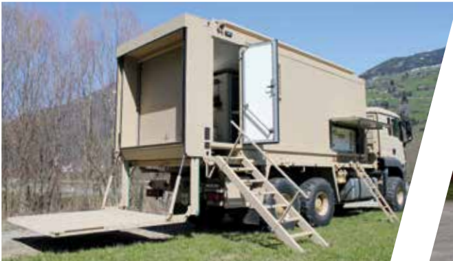
Transporteur de pièces de rechange, interchangeable Vehículo de transporte de repuestos, intercambiable