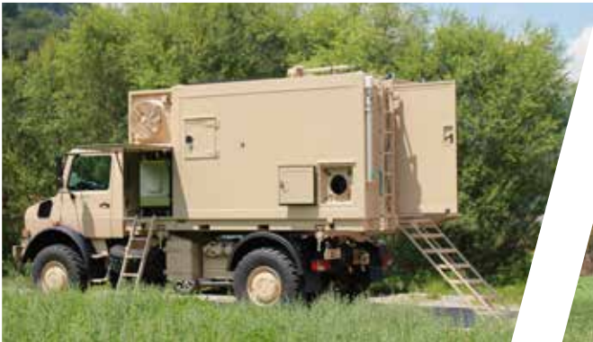
Shelter de commandement, interchangeable Shelter de puesto de mando, intercambiable