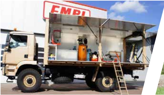
Superstructure de réparation de pneus Carrocería de taller de reparación de neumáticos