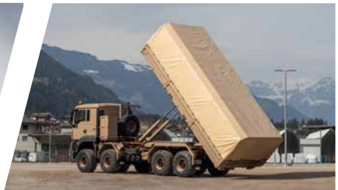
Bras de manutention à crochet avec plateforme de transport Sistema de gancho con bastidor plano