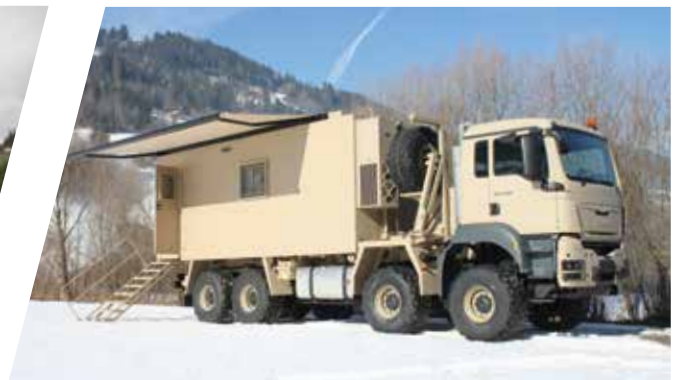
Superstructure de commandement Carrocería de puesto de mando