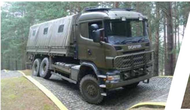
Transport de troupes avec banquette centrale Vehículo de transporte de tropas con banco de asientos central