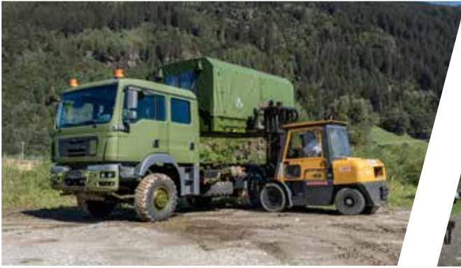
Système interchangeable Carrocerías intercambiables