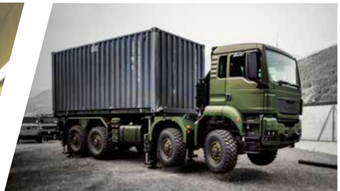
Contrôle du système de nivellement Comprobación del sistema de nivelación