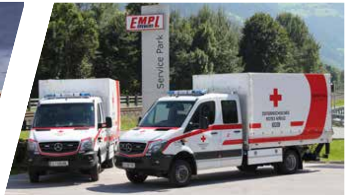
Véhicule d'approvisionnement médical Vehículo de suministros médicos