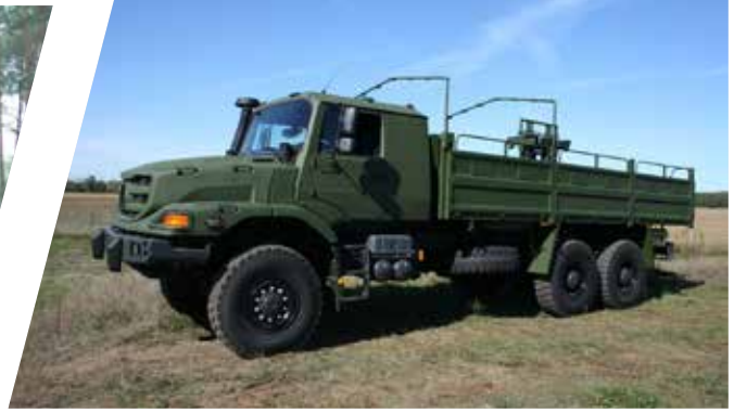
Transport de troupes avec ridelles blindées et sièges de sécurité Vehículo de transporte de tropas con cartolas blindadas y asientos de seguridad