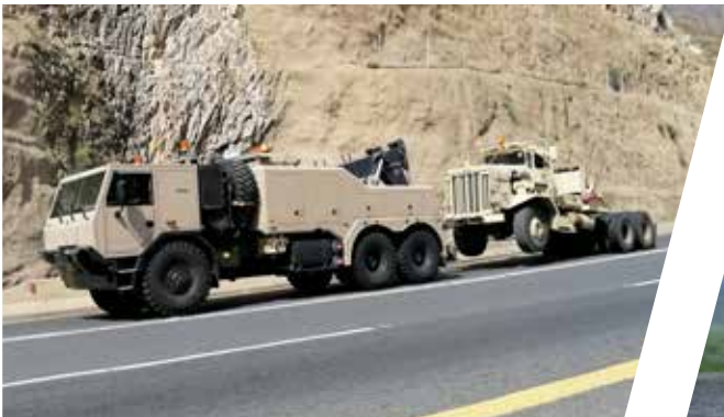
Dépanneuse EH/W 200 Bison Vehículo de rescate EH/W 200 Bison