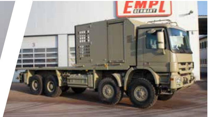
Système de nivellement avec caisses de rangement Sistema de nivelación con módulo de almacenamiento