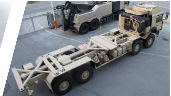
Double châssis porteur de shelter résistant à la torsion Doble bastidor portashelter sin torsión