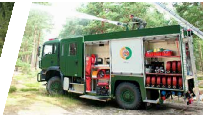
Camion-citerne anti-incendie Vehículo cisterna de lucha contra incendios