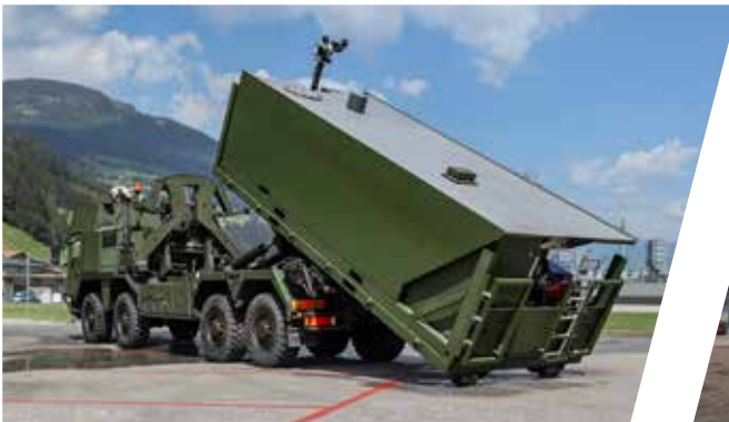
Système de chargement à crochet avec conteneur d'extinction Sistema de gancho de carga con contenedor de extinción de incendios