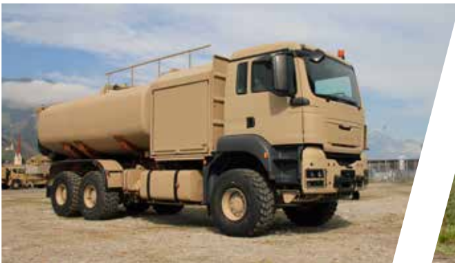
Ravitailleur d'avion Vehículo de repostaje para aeronaves