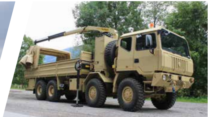
Plateau avec bâche coulissante et grue Plataforma con lona corrediza y grúa