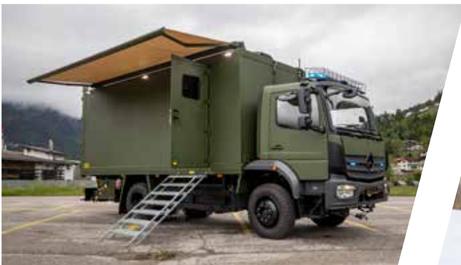
Véhicule d'élimination de munitions non explosées Vehículo de desactivación de explosivos