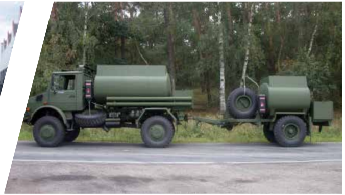
Citerne de carburant avec remorque Cisterna de combustible con remolque