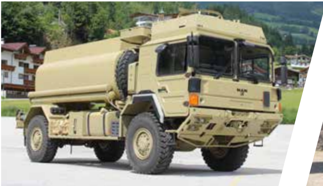
Citerne de carburant Cisterna de combustible