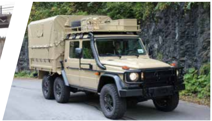
Transport de troupes avec coffre de toit Vehículo de transporte de tropas con cofre de techo