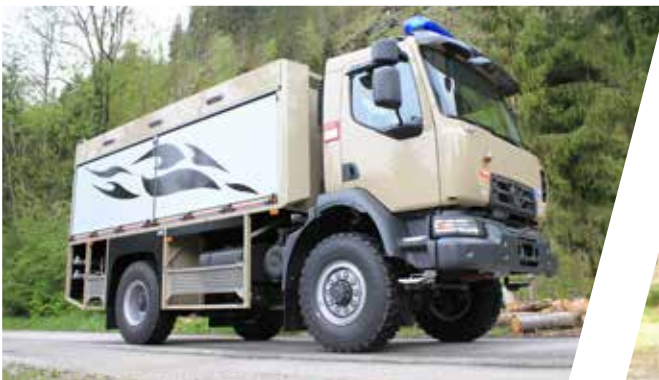
Camion-citerne anti-incendie Vehículo cisterna de lucha contra incendios