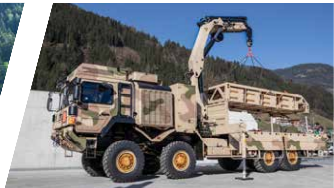
Plateau avec grue Plataforma con grúa