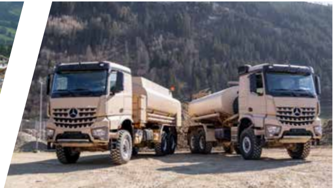
Citerne d'eau et de carburant Cisterna de agua y combustible