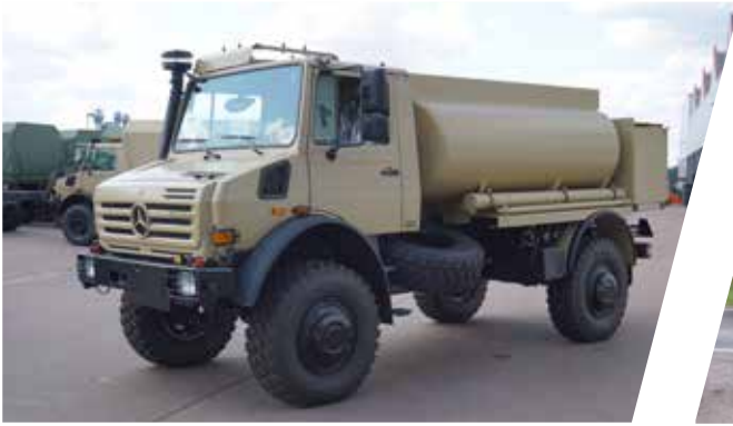
Citerne de carburant Cisterna de combustible