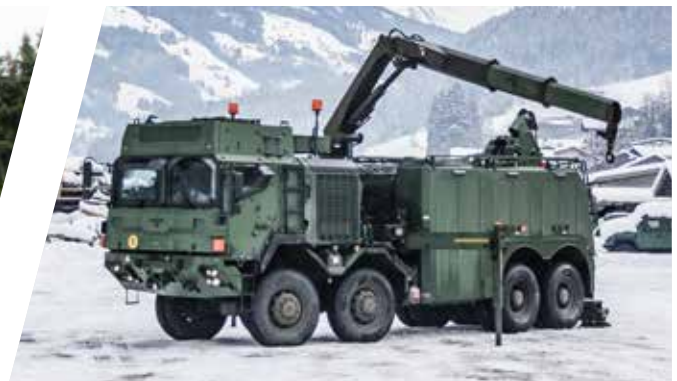
Dépanneuse EH/W 200 Bison avec grue Vehículo de rescate EH/W 200 Bison con grúa