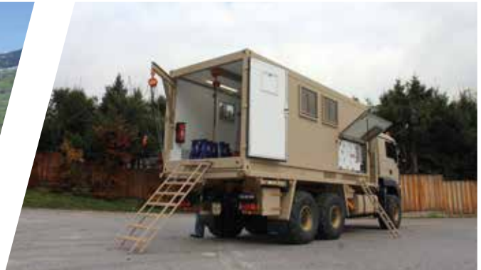
Superstructure d'atelier mobile, interchangeable Carrocería de taller móvil, intercambiable