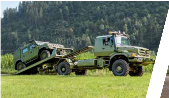
Plateau coulissant Plataforma deslizante