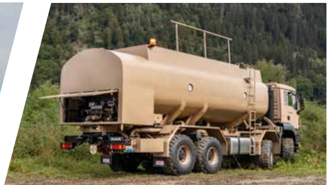
Citerne de carburant Cisterna de combustible