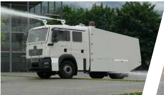
Véhicule anti-émeute Vehículo antidisturbios

Ofrecemos una amplia gama de vehículos antidisturbios con o sin protecciones. Estos vehículos se diseñan en estrecha colaboración con nuestro departamento de desarrollo y están disponibles con diversos sistemas de protección eléctrica, monitores y mezclas de gases lacrimógenos y de pintura.