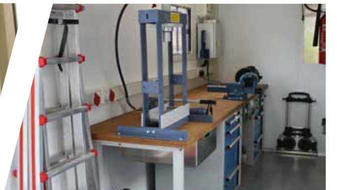
Aménagement intérieur d'atelier mobile Equipamiento interior del taller móvil