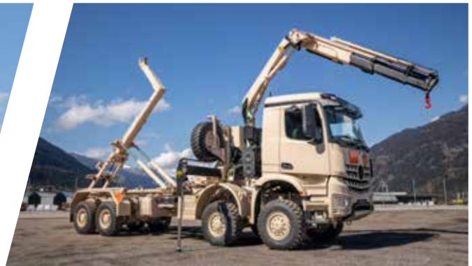
Système de chargement à crochet avec grue Sistema de gancho de carga con grúa