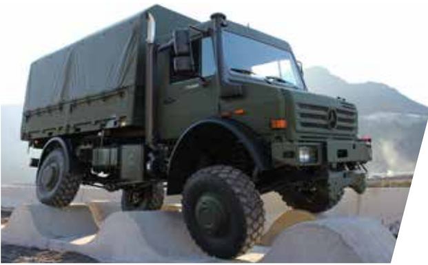
Überprüfung der dynamischen Verwindungsfähigkeit Dynamic Torsion Test