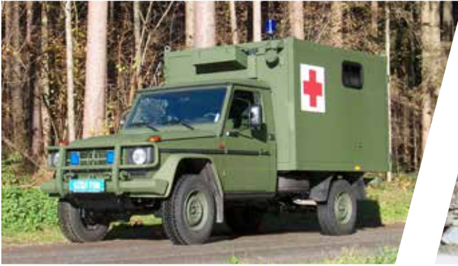
Geländegängiger Krankentransportwagen All-terrain Mobile Patient Transport Ambulance