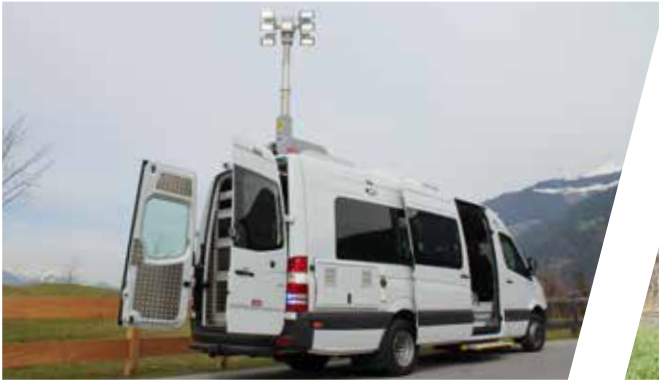
Mobile Kontrollstelle Mobile Checkpoint Screening Van