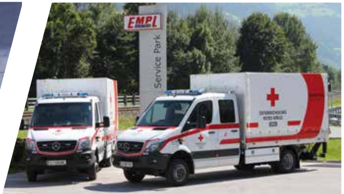
Medizinisches Versorgungsfahrzeug Medical Supply Vehicle