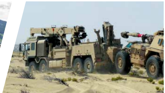
Schweres Bergefahrzeug EH/TC G6 Heavy Duty Recovery Vehicle EH/TC G6