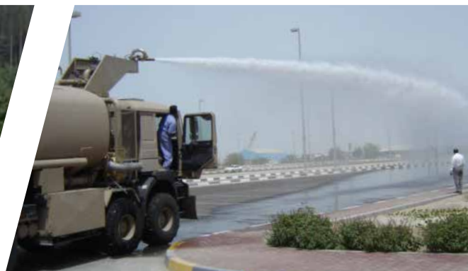
Anti-Demo Fahrzeug Anti-Riot-Vehicle