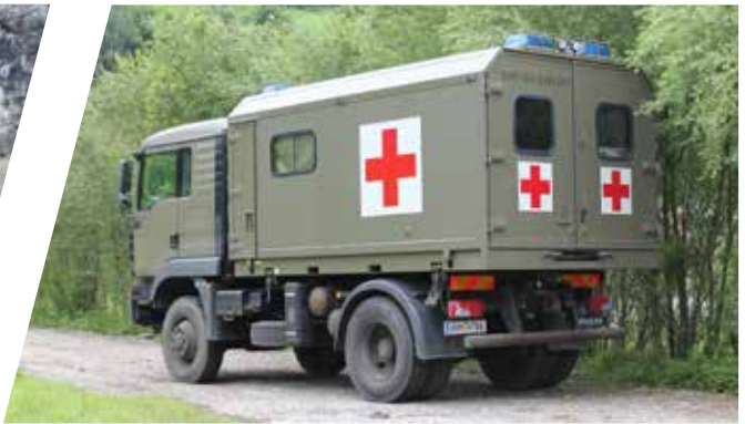
Krankentransportwagen, wechselbar Mobile Patient Transport Ambulance, interchangeable