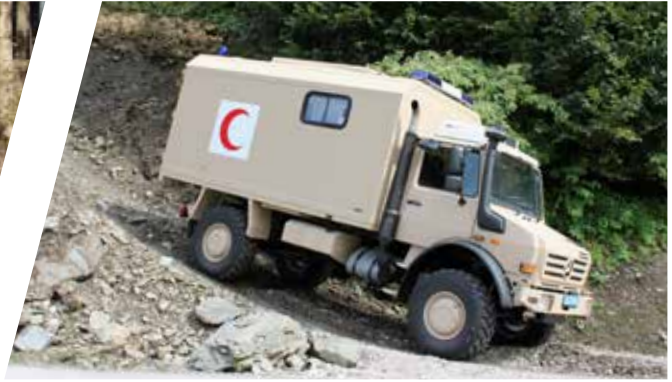
Geländegängiger Krankentransportwagen All-terrain Mobile Patient Transport Ambulance