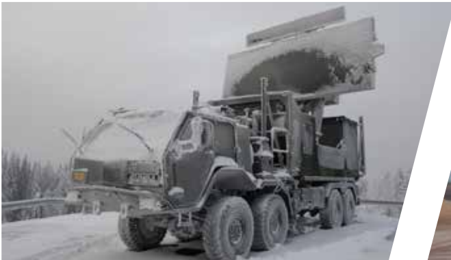
Nivelliersystem Stabilising Truck System