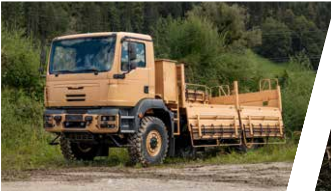
Truppentransporter mit klappbaren Seitensitzbänken Troop Carrier with foldable side seat benches