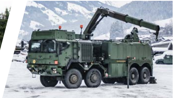
Bergefahrzeug EH/W 200 Bison mit Kran Heavy Duty Recovery Vehicle EH/W 200 Bison with Crane