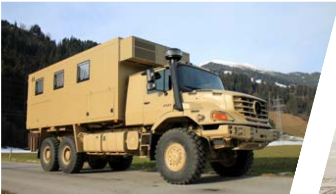
Mobile Werkstatt Mobile Workshop