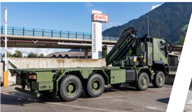
Containerrahmen mit Kran und Winde Shelter Frame with Crane and Winch