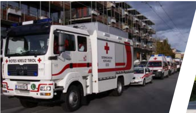
Großunfallfahrzeug Medical Rescue Vehicle for major accidents