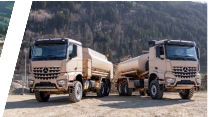
Wasser- und Treibstofftank Water and Fuel Tank Body