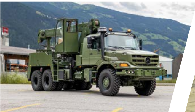
Schweres Kran-Bergefahrzeug EH/TC Heavy Duty Crane Recovery Vehicle EH/TC