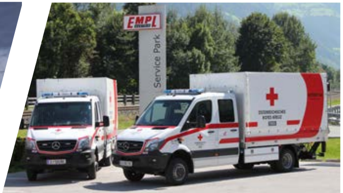
Medizinisches Versorgungsfahrzeug Medical Supply Vehicle