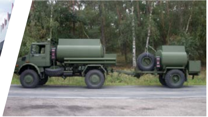
Treibstofftank mit Anhänger Fuel Tank Body with Trailer