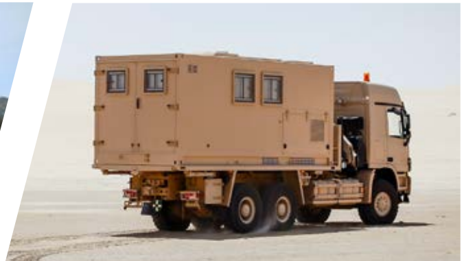
Mobiler Werkstatt-Aufbau, wechselbar Mobile Workshop Shelter, interchangeable