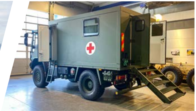
Geländegängiger Notarztwagen All-terrain Mobile Emergency Ambulance