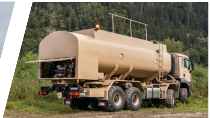
Treibstofftank Fuel Tank Body