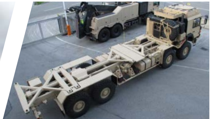
Doppelter verwindungsfreier Sheltertragrahmen Twin torsion free shelter carrier