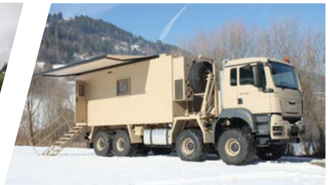
Kommando Aufbau Command and Control Body