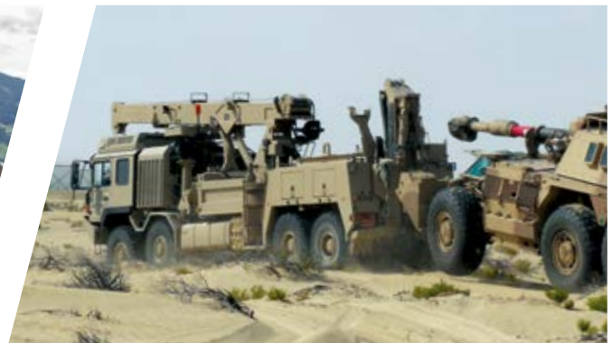
Schweres Bergefahrzeug EH/TC G6 Heavy Duty Recovery Vehicle EH/TC G6