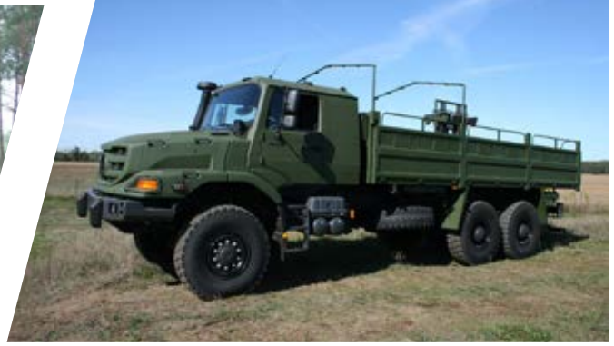
Truppentransporter mit gepanzerten Bordwänden & Sicherheitssitzen Troop Carrier with armored walls & safety seats