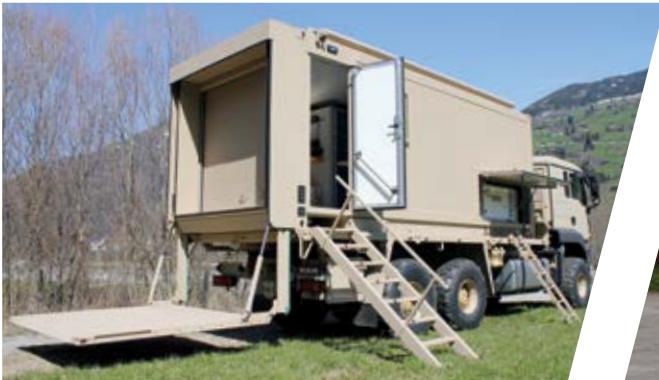
Ersatzteil-Transporter, wechselbar Spare Parts Shelter, interchangeable