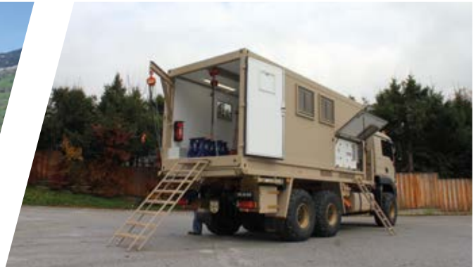
Mobiler Werkstatt-Aufbau, wechselbar Mobile Workshop Shelter, interchangeable