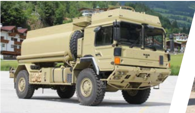
Treibstofftank Fuel Tank Body