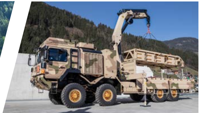
Pritsche mit Kran Cargo Body with Crane