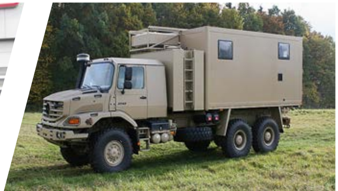
Waschküchen Aufbau Mobile Laundry Body