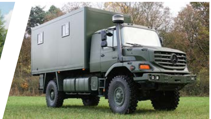
Gefangenentransporter Prisoner Transport Body