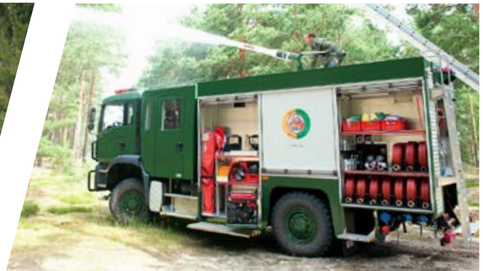
Tanklöschfahrzeug Rescue Pumper