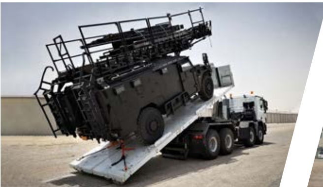
Hakenladesystem mit Flat Rack Hook Loading System with Flat Rack