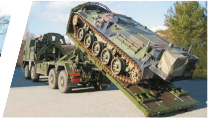
Hakenladesystem mit CHU und Flat Rack Hook Loading System with CHU and Flat Rack