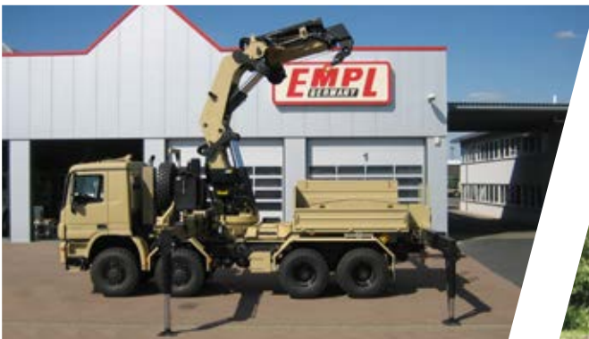
150 mto Kran mit Ballastpritsche 150 mto Crane with Ballast Cargo Body