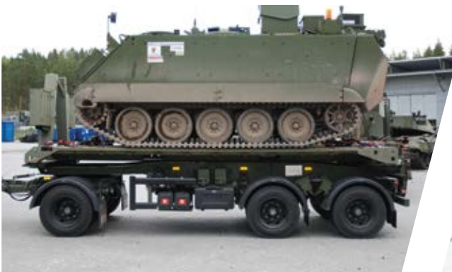
Schlitten-Anhänger Trailer with Sliding Tray

Furthermore, the complete equipment for semitrailer tractors including winch systems, fifth wheel couplings and all accessories are possible.