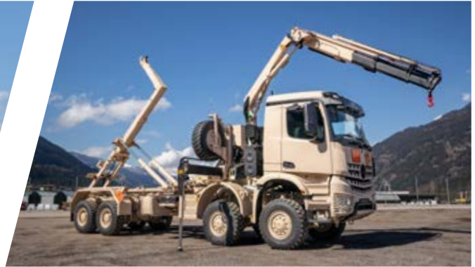
Hakenladesystem mit Kran Hook Loading System with Crane