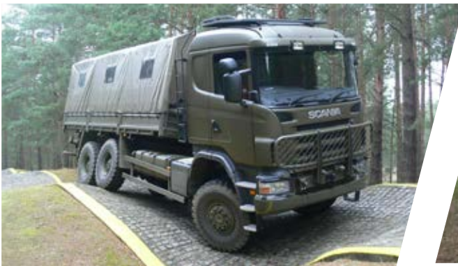
Truppentransporter mit Mittelsitzbank Troop Carrier with central bench