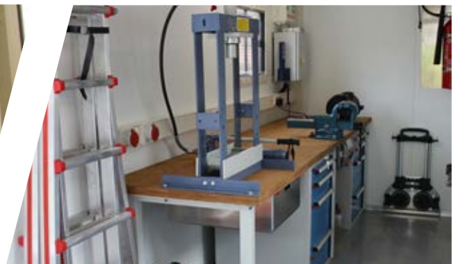
Inneneinrichtung Mobile Werkstatt Interior Mobile Workshop