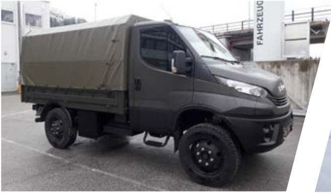
Truppentransporter mit Heckklappe & Einzelsitzen (8 Personen) Troop Carrier with tailgate & single seats (8 persons)