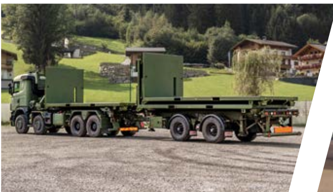
HLS mit Zentralachsanhänger und Flat Racks HLS with Tandem Trailer and Flat Racks