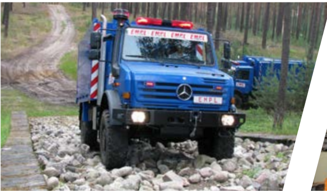
Fahrzeugüberprüfung am losen Geröllhang Verification of vehicle on loose gravel slope