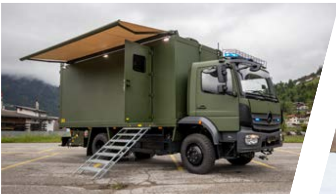
Kampfmittelbeseitigungsfahrzeug Explosive Ordnance Disposal Vehicle