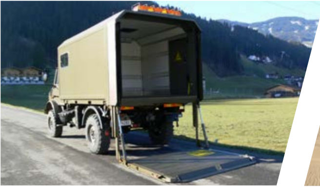
Wechselaufbau Koffer mit Hecklift Interchangeable Van Type Body with Hydraulic Tailgate