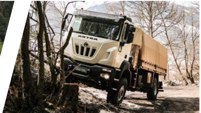
Truppentransporter mit klappbaren Seitensitzbänken (24 Personen) Troop Carrier with foldable side seat benches (24 persons)