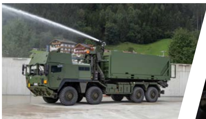
Hakenladesystem mit Löschcontainer (LCS) Hook Loading System with Fire Fighting Container