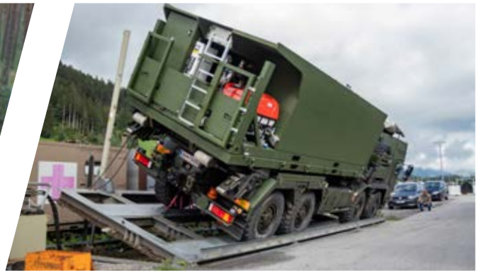
Statischer Kipptest Static Tilting Test