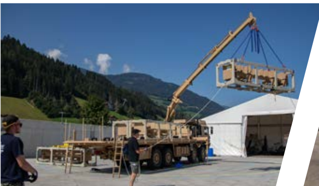
Kran Test Crane Test