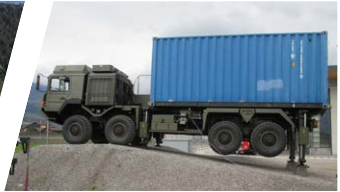
Nivelliersystem Stabilising Truck System