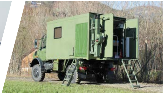
Kommando Aufbau Command and Control Shelter