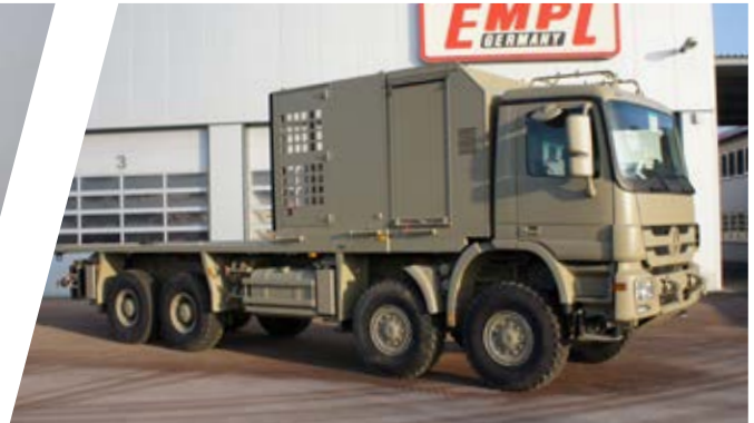
Nivelliersystem mit Staukästen Stabilising Truck System with Storage