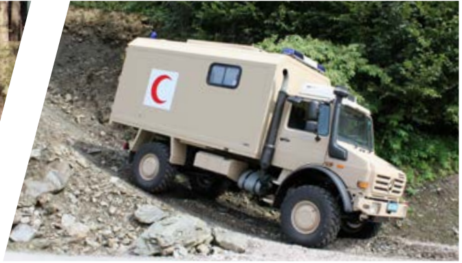
Geländegängiger Krankentransportwagen All-terrain Mobile Patient Transport Ambulance