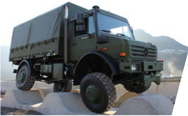
Überprüfung der dynamischen Verwindungsfähigkeit Dynamic Torsion Test