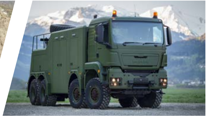
Bergefahrzeug EH/W 200 Bison Heavy Duty Recovery Vehicle EH/W 200 Bison