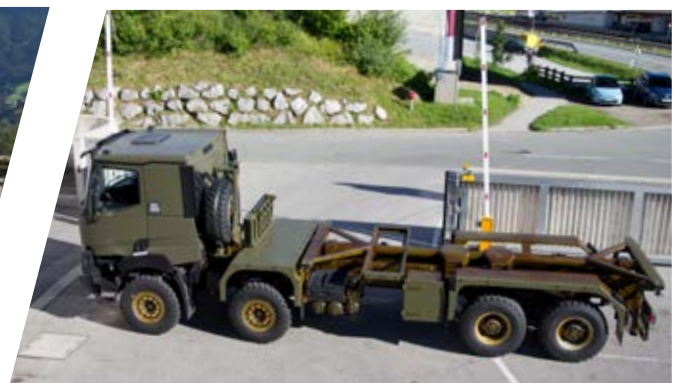
Containerrahmen Shelter Frame