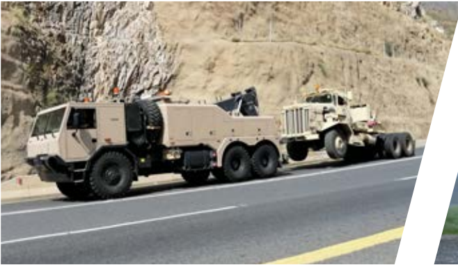
Bergefahrzeug EH/W 200 Bison Heavy Duty Recovery Vehicle EH/W 200 Bison