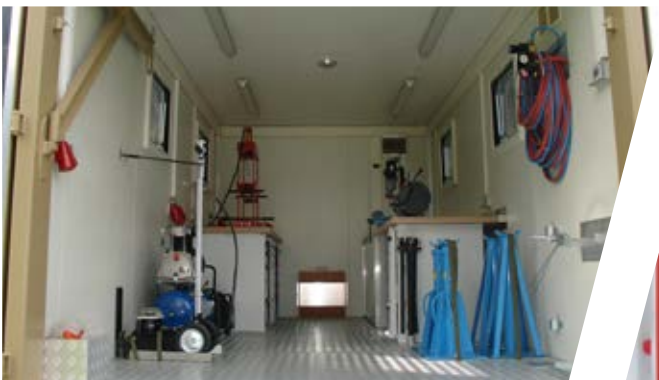
Inneneinrichtung Mobile Werkstatt Interior Mobile Workshop