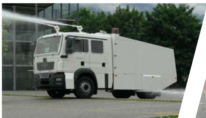
Anti-Demo Fahrzeug Anti-Riot-Vehicle

We offer a wide range of anti-riot vehicles as protected or unprotected versions. These are designed in close cooperation with our Fire Fighting development department and are available with various electric protection systems, monitors, tear gas addition and paint addition.