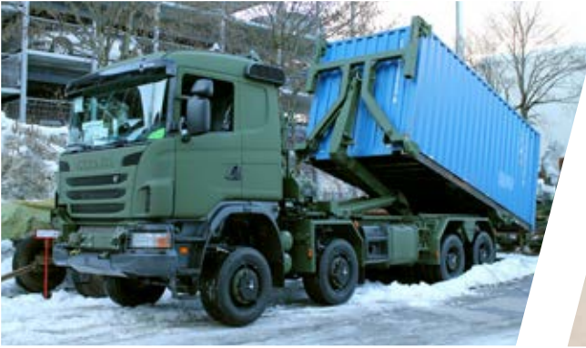
Hakenladesystem mit CHU Hook Loading System with CHU