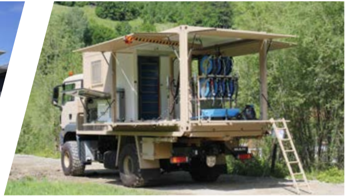
Schmierdienstsaufbau wechselbar Lubrication Shelter, interchangeable