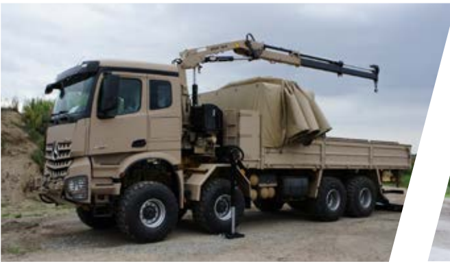
Pritsche mit Schieberverdeck und Kran Cargo Body with Sliding Tarpaulin and Crane