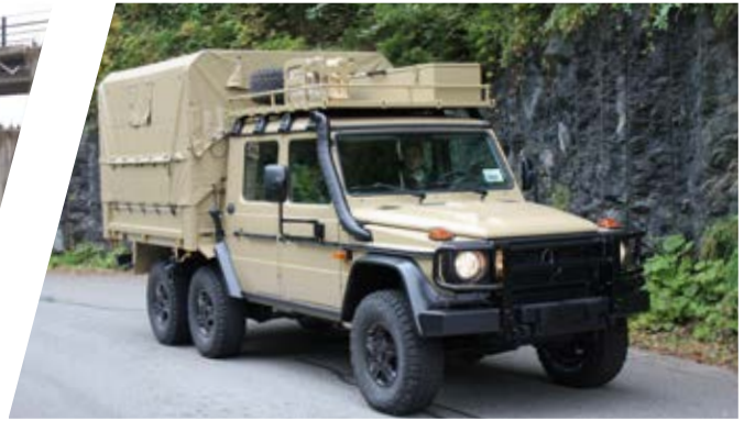
Truppentransporter mit Dachbox (10 Personen) Troop Carrier with roof box (10 persons)