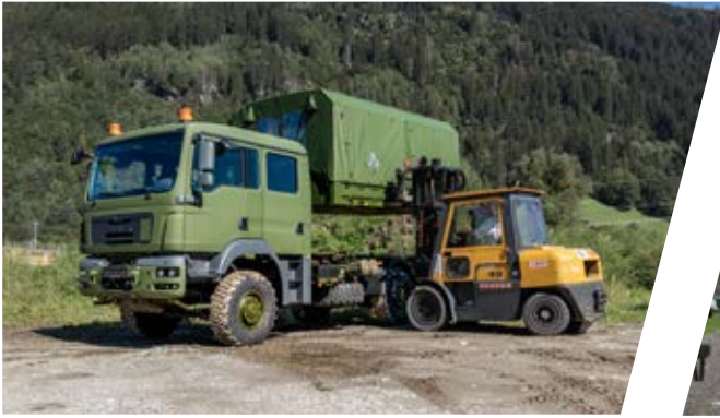
Wechselsystem Interchangeable Body System