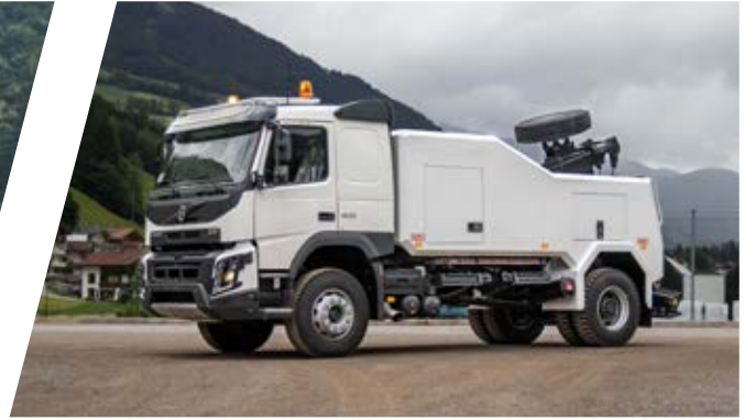
Bergefahrzeug EH/W 150 Medium Recovery Vehicle EH/W 150