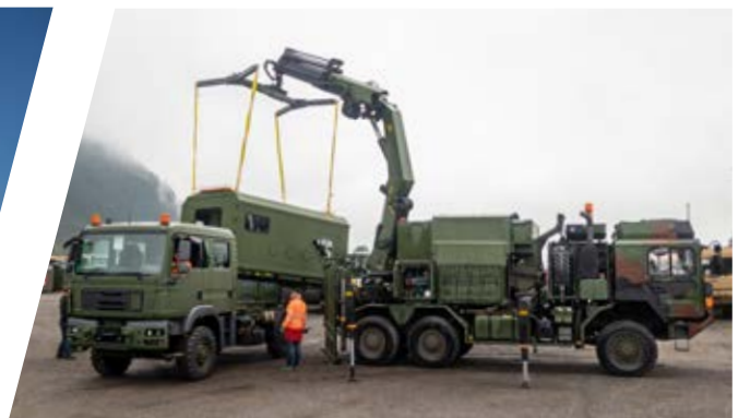
Überprüfung Wechselsystem Verification of Interchangeable Systems