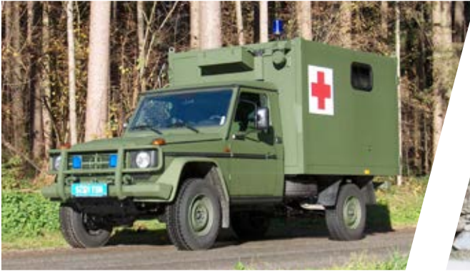
Geländegängiger Krankentransportwagen All-terrain Mobile Patient Transport Ambulance