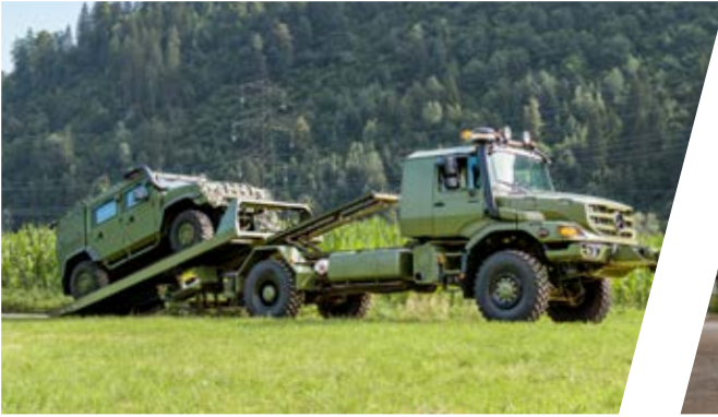
Schiebepalette Sliding Platform