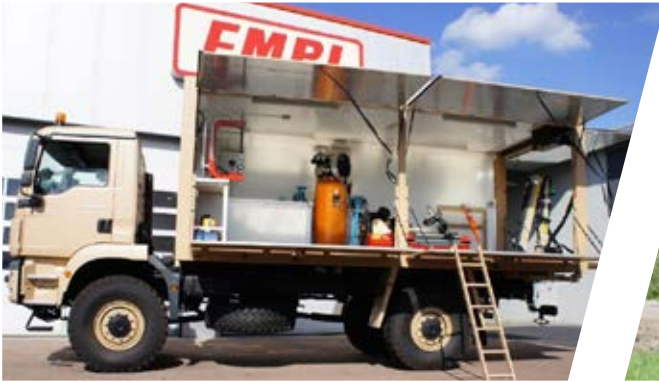
Reifenreparatur-Aufbau Tyre Repair Workshop Body