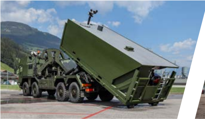
Hakenladesystem mit Löschcontainer (LCS) Hook Loading System with Fire Fighting Container