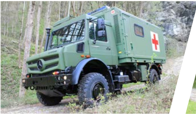
Geländegängiger Notarztwagen All-terrain Mobile Emergency Ambulance