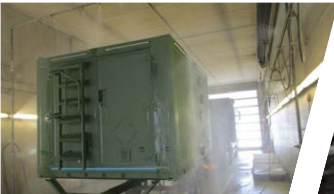
Dichtheitsprüfung / Regentest Leak Detection / Rain Test