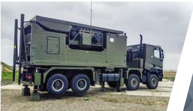
Nivelliersystem Stabilising Truck System