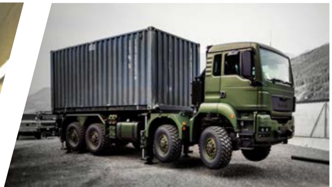
Überprüfung Nivelliersystem Verification of Stabilising Systems