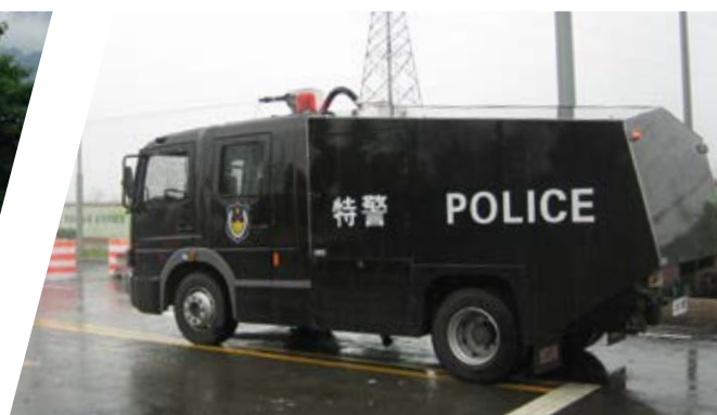
Anti-Demo Fahrzeug Anti-Riot-Vehicle