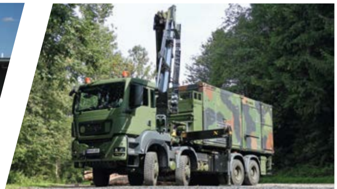
Systemaufbau für Dekontaminationsmodule System Carrier for Decontamination Module