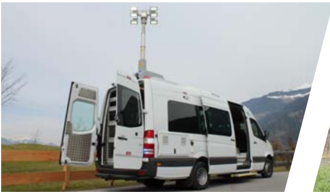
Mobile Kontrollstelle Mobile Checkpoint Screening Van