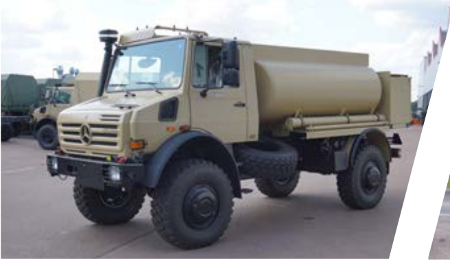
Treibstofftank Fuel Tank Body