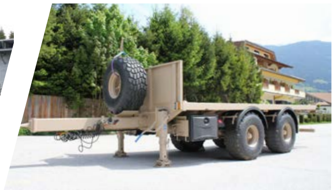
Zentral-Achs-Anhänger Tandem Trailer