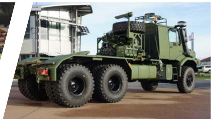
Sattelzugmaschinen-Ausstattung Tractor Head Equipment