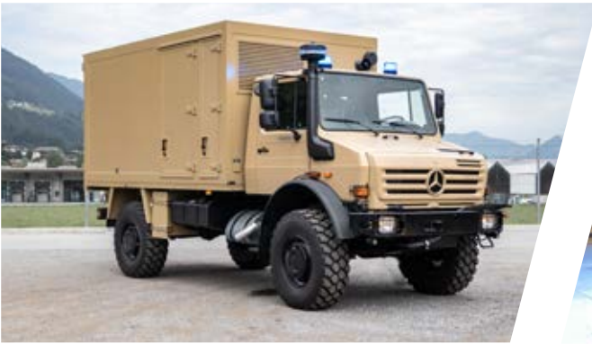
Geländegängige Ambulanz All-terrain Ambulance