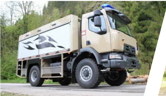
Tanklöschfahrzeug Rescue Pumper