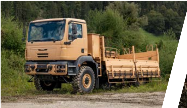
Truppentransporter mit klappbaren Seitensitzbänken Troop Carrier with foldable side seat benches