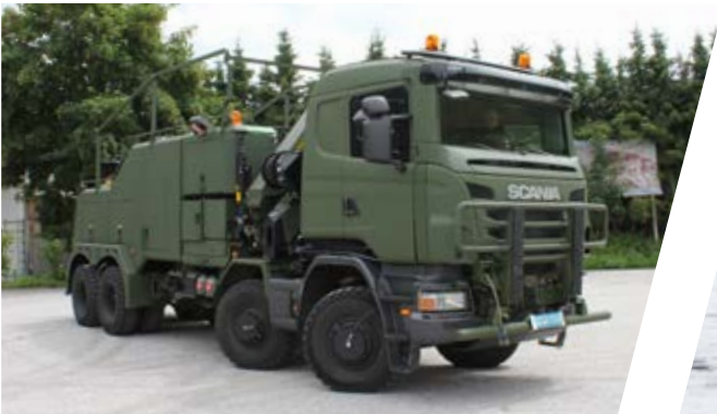
Bergefahrzeug EH/W 200 Bison mit Kran Heavy Duty Recovery Vehicle EH/W 200 Bison with Crane