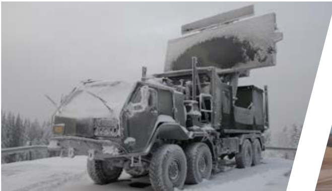
Nivelliersystem Stabilising Truck System