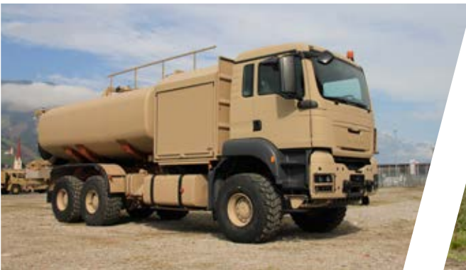
Flugzeugbetankungsfahrzeug Aircraft Refueller