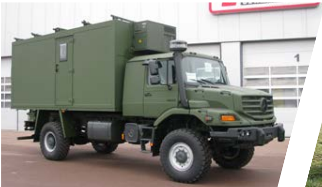
Funk-Shelter Radio Vehicle