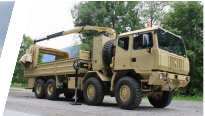
Pritsche mit Schieberverdeck und Kran Cargo Body with Sliding Tarpaulin and Crane