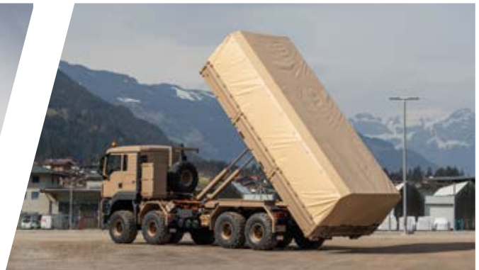
Hakenladesystem mit Flat Rack Hook Loading System with Flat Rack