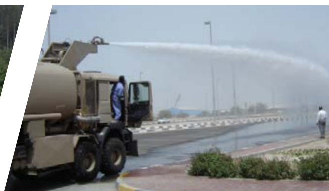
Anti-Demo Fahrzeug Anti-Riot-Vehicle