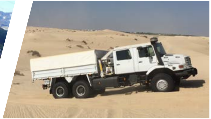
Pritsche mit Schieberverdeck und Kran Cargo Body with Sliding Tarpaulin and Crane