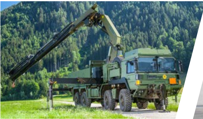
Pritsche mit Kran Cargo Body with Crane