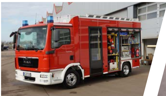
Mittleres Löschfahrzeug, MLF Medium Fire Fighting Vehicle