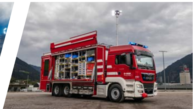
Rüstwagen mit Seiten- und Hecklift, RW Rescue Vehicle with side and rear lift