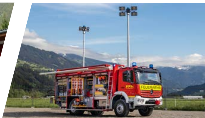
Rüstwagen, RW Rescue Vehicle