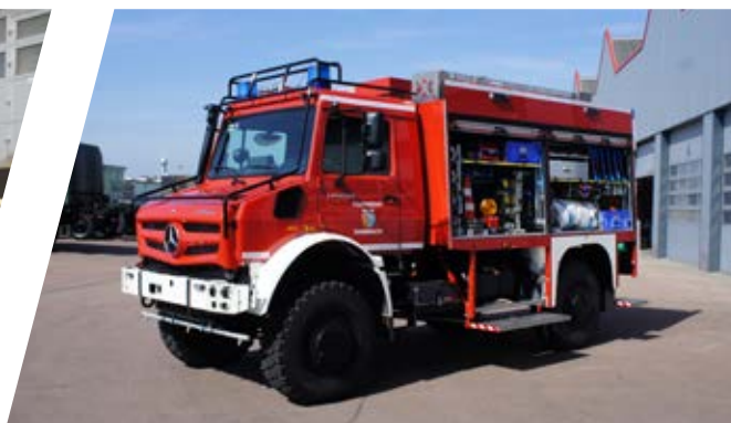
Tanklöschfahrzeug, TLF 2000 Pumper 2000