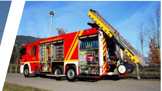
Industrielöschfahrzeug, ILF Industrial Fire Fighting Vehicle