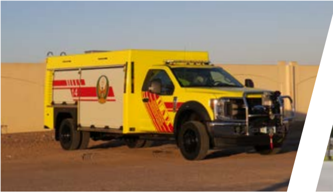
Schnellangriffsfahrzeug Rapid Intervention Vehicle, RIV