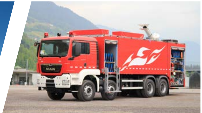
Tanklöschfahrzeug, TLF 20000 Pumper 20000