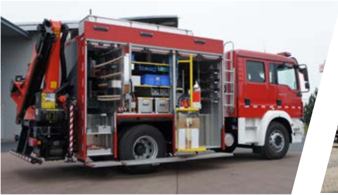
Rüstwagen mit Kran, RW-K Rescue Vehicle with crane