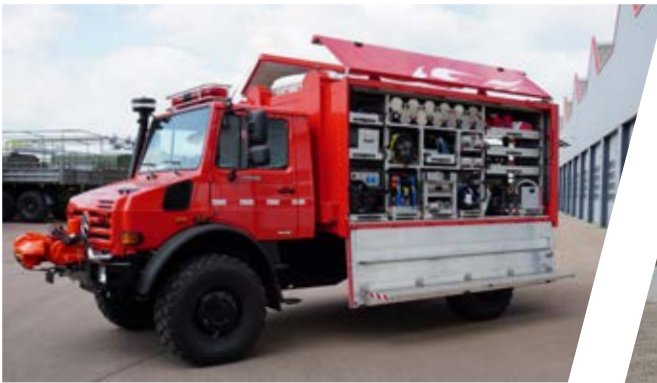
Rüstwagen, RW Rescue Vehicle