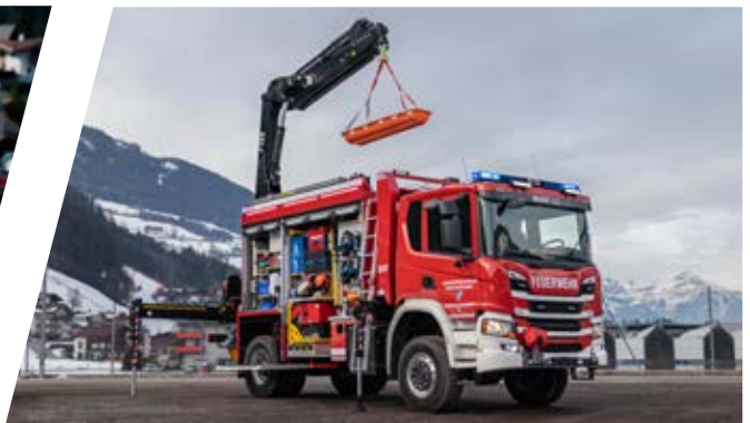
Schweres Rüstfahrzeug mit Kran, SRF-A Heavy Duty Rescue Vehicle with crane