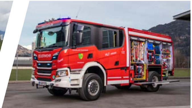
Hilfeleistungslöschgruppenfahrzeug, HLF 4000/200 Rescue Pumper 4000/200