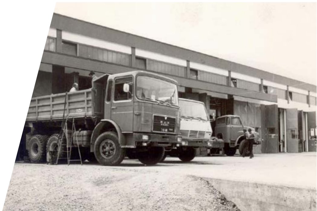
Altes Werk Kaltenbach im Jahr 1970 Plant in the year 1970

In an efficient interplay of longstanding, experienced employees and state-of-the-art machinery, we manufacture small and large runs, which are also available as (CKD, SKD) modular kits. For many large projects and tenders, EMPL acts as a general contractor and system integrator. An efficiently functioning overall system can only be ensured through intelligent combination of the individual components.