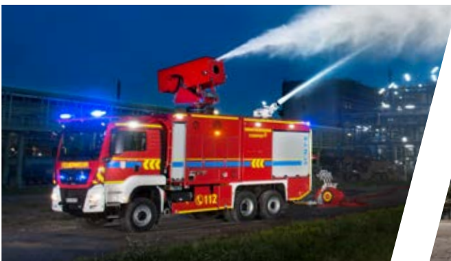
Turbinenuniversallöschfahrzeug, TULF Hydro Jet Fire Fighting Vehicle