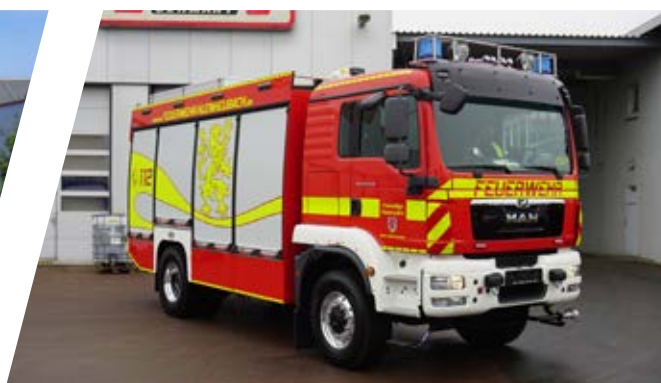
Tanklöschfahrzeug, TLF 4000 Pumper 4000