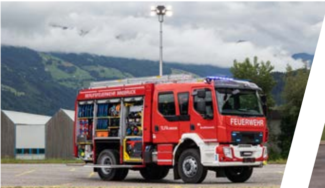
Tanklöschfahrzeug, TLF-A 2000 Pumper 2000