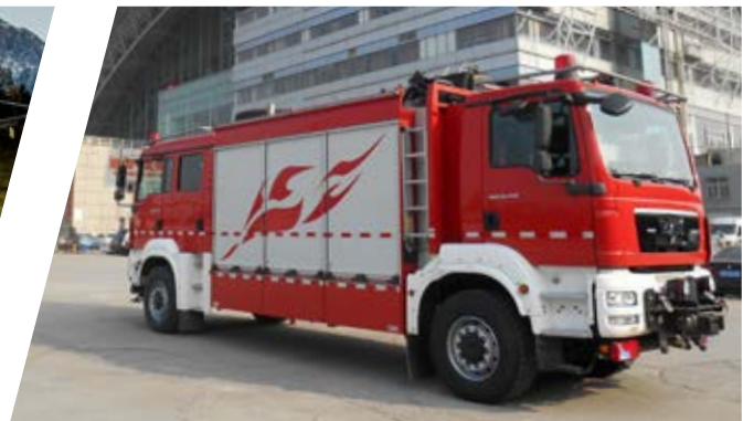
Tanklöschfahrzeug Double Head Pumper Double Head (Tunnel Extinguishing Vehicle)