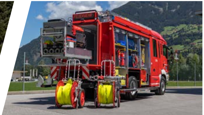
Löschfahrzeug mit Bergeausrüstung PRIMUS, LFB-A Pumper with rescue equipment