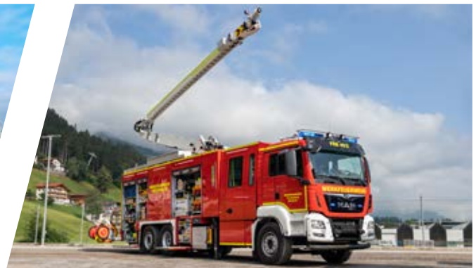
Industrielöschfahrzeug mit Scorpio Löscharm, ILF Industrial Fire Fighting Vehicle with extinguishing boom „Scorpio“