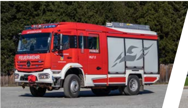
Hilfeleistungslöschgruppenfahrzeug PRIMUS, HLF 2 Rescue Pumper PRIMUS