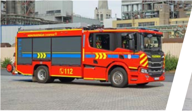
Hilfeleistungslöschgruppenfahrzeug, HLF Rescue Pumper