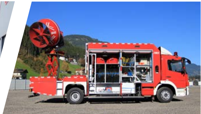
Großlüftfahrzeug Ventilator Vehicle