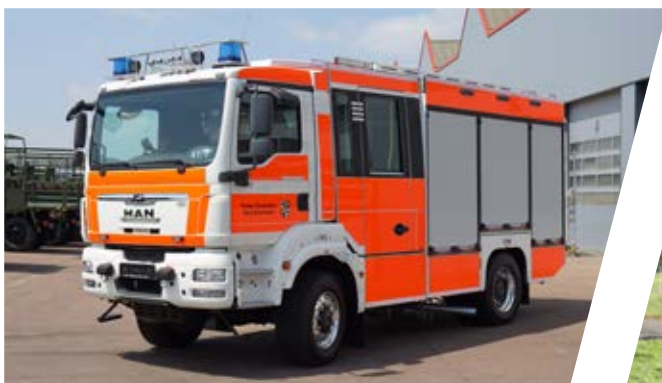
Löschgruppenfahrzeug für Katastrophenschutz, LF 20 Kat Pumper for civil protection