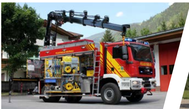
Rüstwagen mit Kran, RW-K Rescue Vehicle with crane