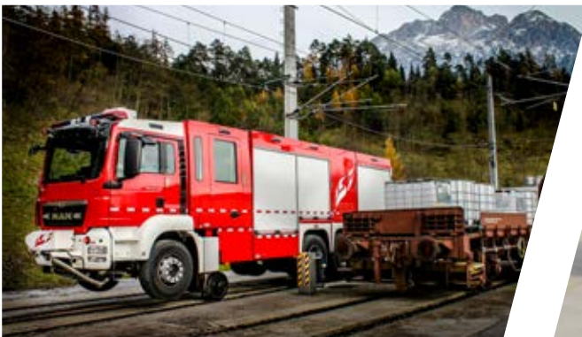
Zweiwegefahrzeug Two-way Vehicle