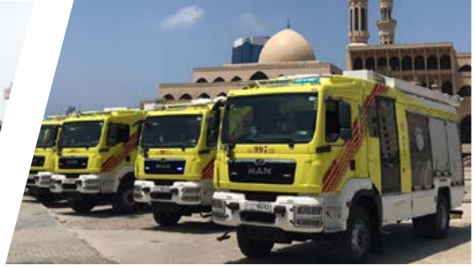
Tanklöschfahrzeug PRIMUS, TLF 3000/400 Pumper PRIMUS 3000/400