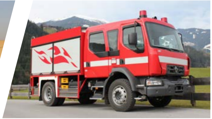
Tanklöschfahrzeug, TLF 1500/500 Pumper 1500/500