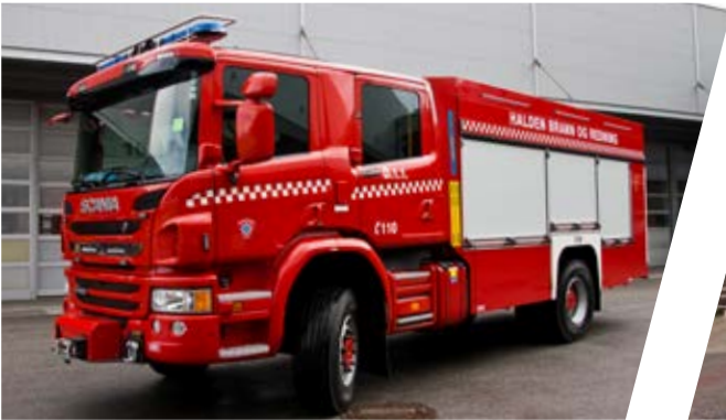
Tanklöschfahrzeug, TLF 3000/50/50 Pumper 3000/50/50