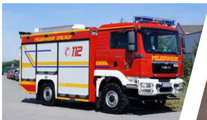
Tanklöschfahrzeug, TLF 3000 Pumper 3000