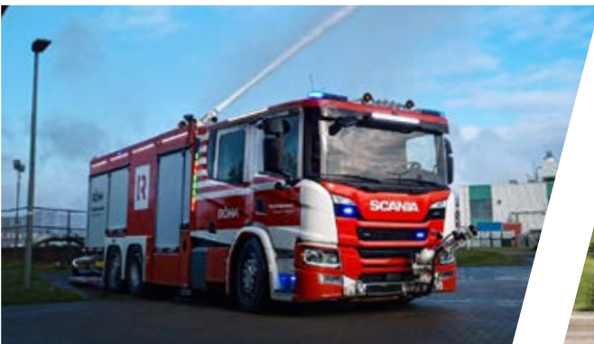
Universallöschfahrzeug, ULF Industrial Fire Fighting Vehicle