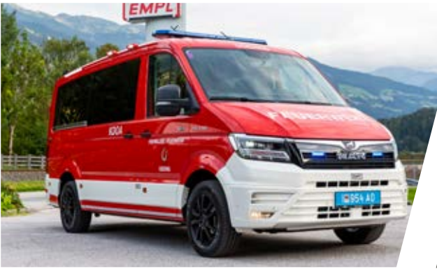
Kommandofahrzeug, KDO Command Vehicle