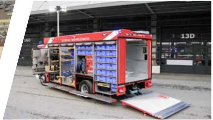
Gerätewagen, GW Support Vehicle