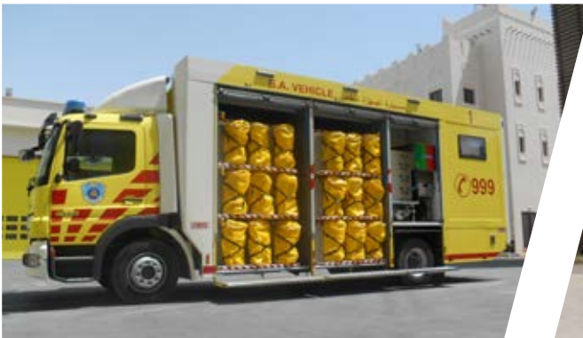
Atemschutzfahrzeug Breathing Apparatus Vehicle