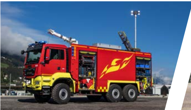
Flughafenlöschfahrzeug, FLF Airport Fire Fighting Vehicle