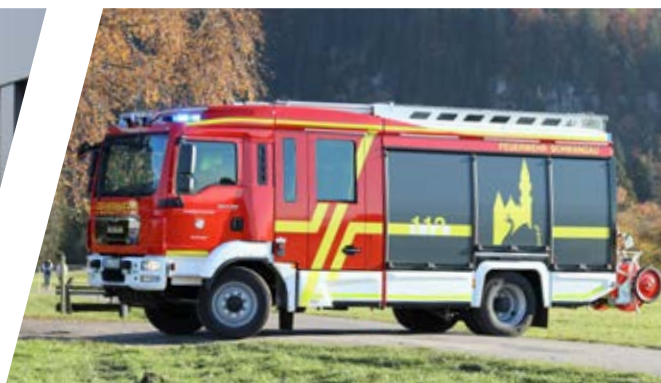
Hilfeleistungslöschgruppenfahrzeug PRIMUS, HLF 20 Rescue Pumper PRIMUS