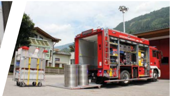
Gefährliche Stoffe Fahrzeug HAZMAT