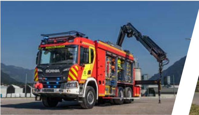
Gerätewagen mit Kran, GW-K Heavy Rescue Vehicle with crane