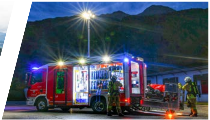
Löschfahrzeug, LF Pumper