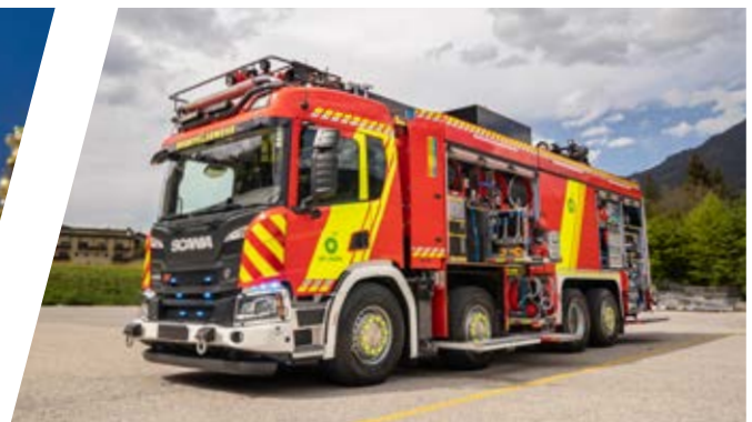
Universallöschfahrzeug mit Scorpio Löscharm, ULF Industrial Fire Fighting Vehicle with extinguishing boom „Scorpio“