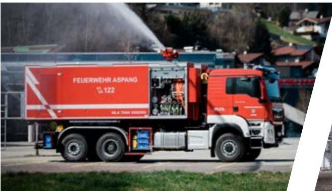
Wechseladefahrzeug, WLF Load Handling System