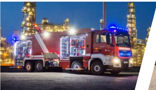
Universallöschfahrzeug, ULF 8000/4000 Industrial Fire Fighting Vehicle 8000/4000