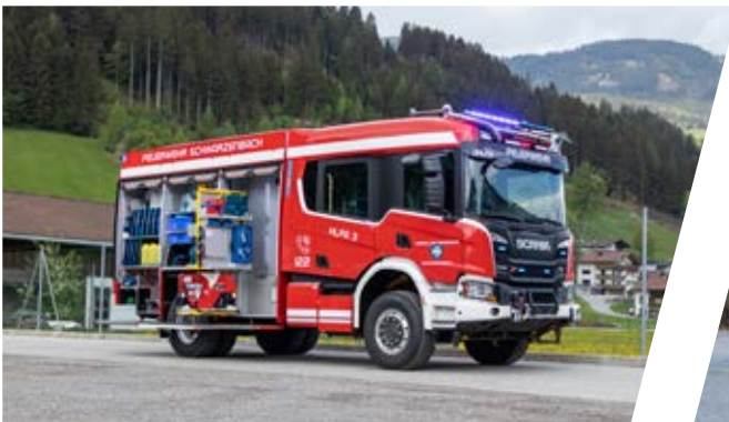
Hilfeleistungslöschgruppenfahrzeug, HLF 3 Rescue Assistance Vehicle