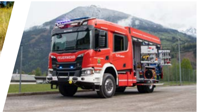
Tanklöschfahrzeug, TLF-A 3000/100 Pumper, TLF-A 3000/100