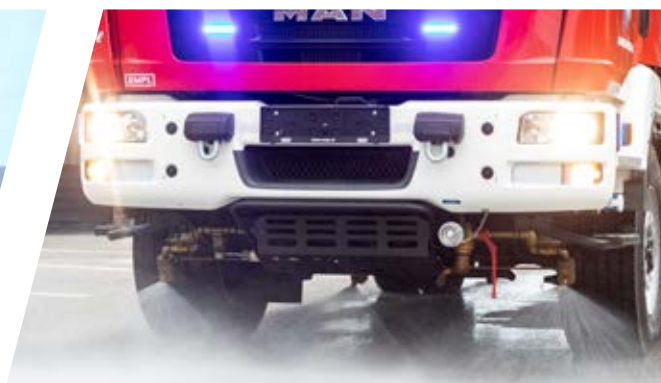
Straßenwasch- und / oder Selbstschutzanlage Street washing nozzles