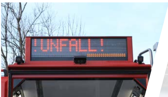
Verkehrsleiteinrichtung Rear warning system