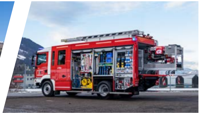
Löschfahrzeug mit Bergeausrüstung, LFB-A Pumper with rescue equipment