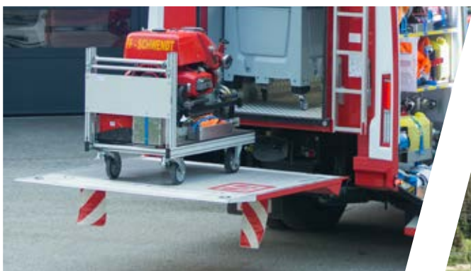
Ladebordwand Tail lift