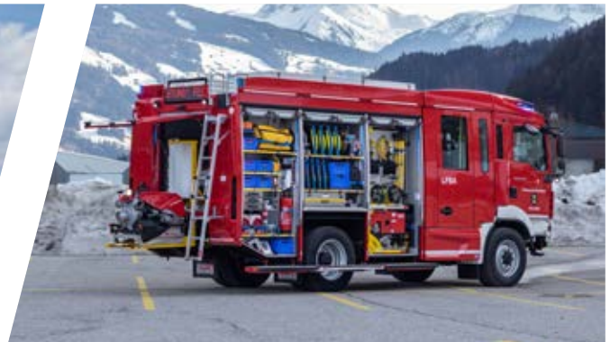
Löschfahrzeug mit Bergeausrüstung, LFB-A Pumper with rescue equipment