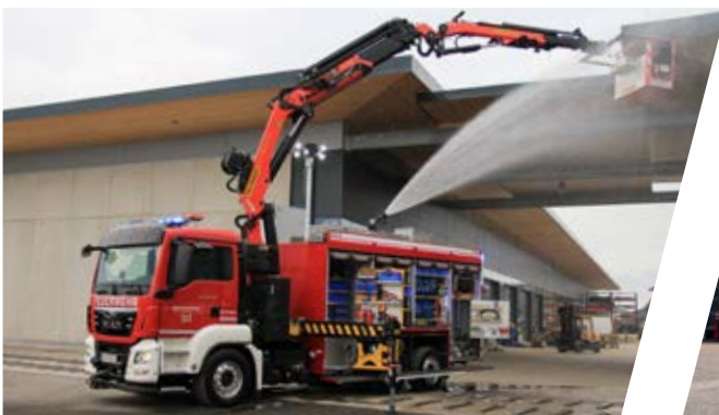
Rüstlöschfahrzeug, RLF Rescue equipment Vehicle with water tank