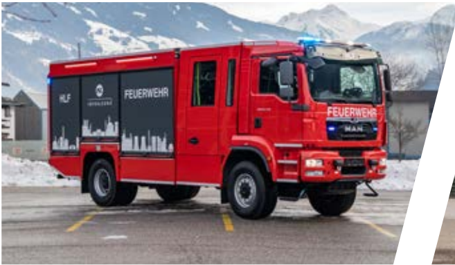
Hilfeleistungslöschgruppenfahrzeug, HLF Rescue Assistance Vehicle