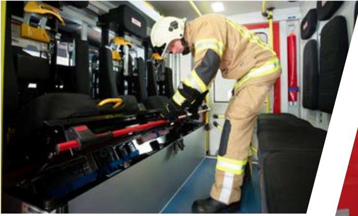
variabel einteilbarer Stauraum in Sitzkästen flexible partitioning of storage space in seat boxes