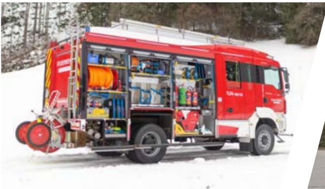
Tanklöschfahrzeug, TLF-A 3000/120 Pumper, TLF-A 3000/120