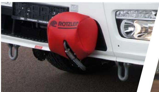
Rahmeneinbauwinde Frame winch