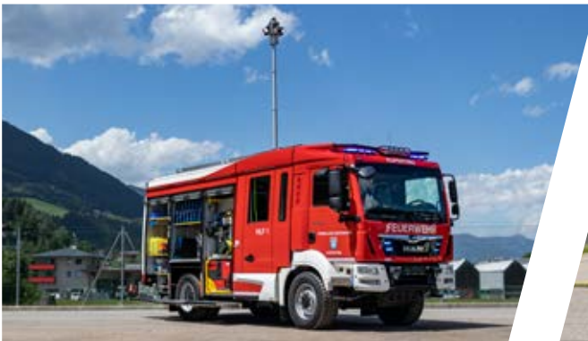
Hilfeleistungslöschgruppenfahrzeug, HLF 1 Rescue Assistance Vehicle