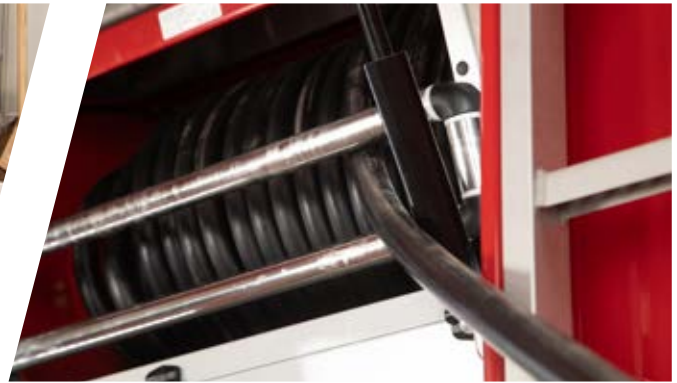
Führungsvorrichtung für Schnellangriff Guiding device for fast attack