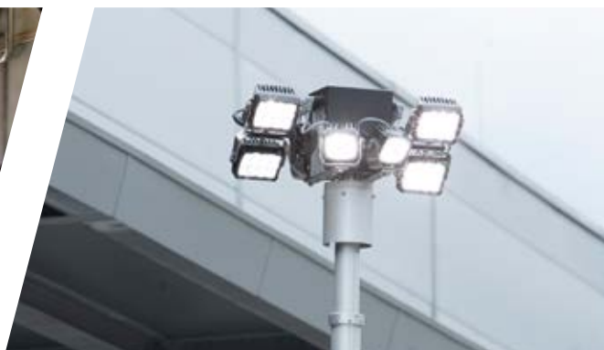
Lichtmast EMPL Function Light Lightmast EMPL Function Light