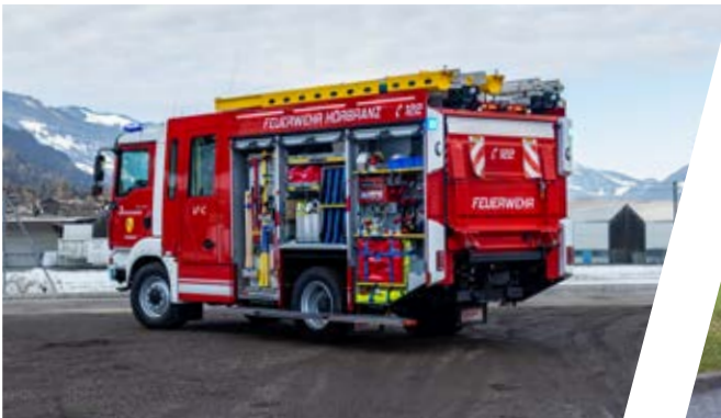
Löschfahrzeug mit Roll-Container, LF-C Pumper with roll-on container