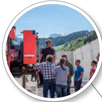
Hausinterne Abnahme durch das Empl Qualitätswesen inkl. Prüfung der Feuerlöscheinrichtung am Pumpenprüfstand In-house approval by the EMPL quality control department including checking of the fire extinguishing unit on the pump test stand