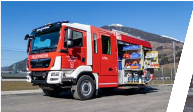
Löschfahrzeug mit Bergeausrüstung, LFB-A Pumper with rescue equipment