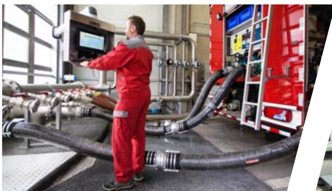
Pumpenprüfstand Pump test stand