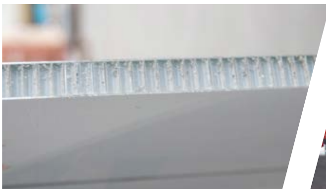
Wabenkernpaneel Honeycombed panels