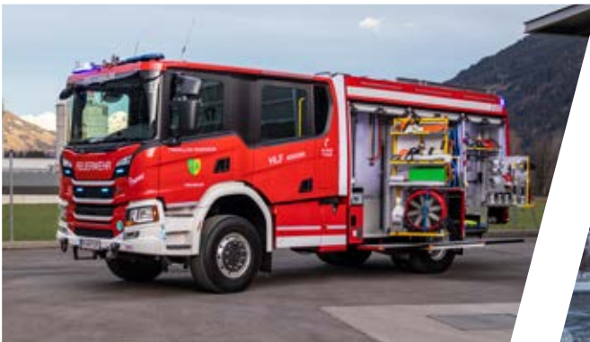
Hilfeleistungslöschgruppenfahrzeug, HLF 3 Rescue Assistance Vehicle