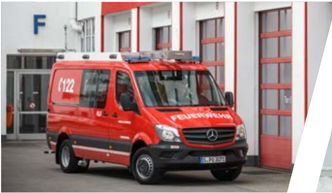
Kleinlöschfahrzeug, KLF Small Pumper