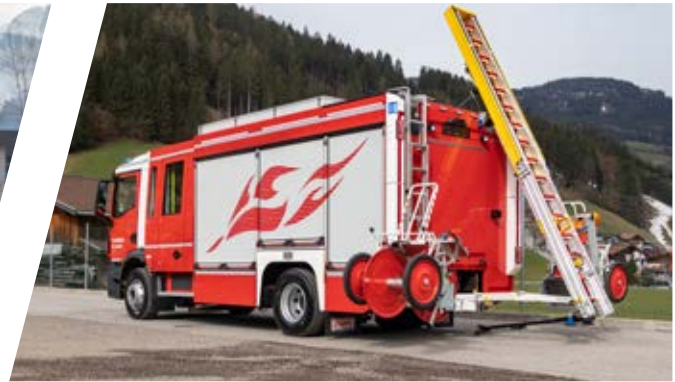
Hilfeleistungslöschgruppenfahrzeug, HLF Rescue Assistance Vehicle