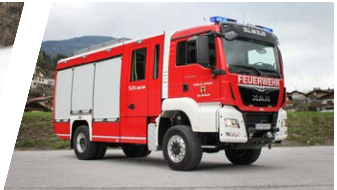
Tanklöschfahrzeug, TLF-A 3000/200 Pumper, TLF-A 3000/200