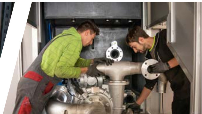
gesamte Verrohrung in Edelstahl-Schweißkonstruktion entire pipework in welded stainless steel design