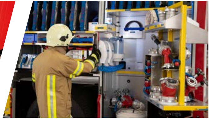
Drehfächer G5 - G6 optional Sliding trap in storage rooms G5 - G6