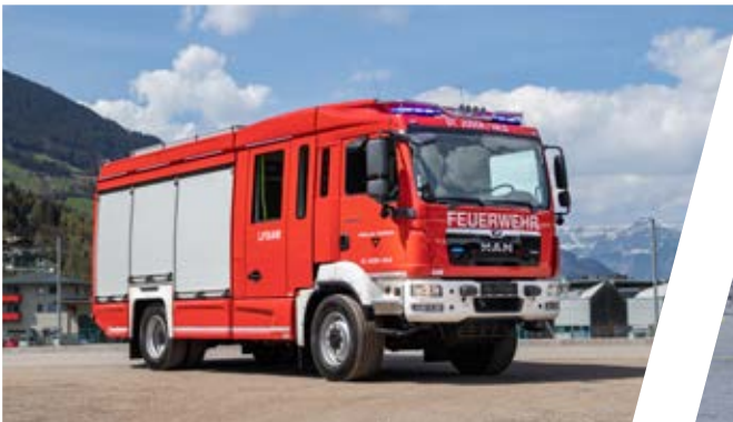
Löschfahrzeug mit Bergeausrüstung, LFB-A Pumper with rescue equipment