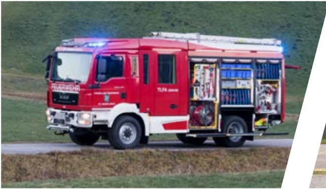
Tanklöschfahrzeug, TLF-A 2000/60 Pumper, TLF-A 2000/60