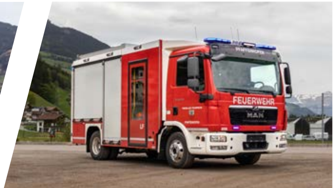
Löschfahrzeug, LF Pumper