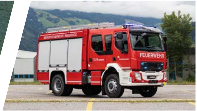
Tanklöschfahrzeug, TLF-A 2000/200 Pumper, TLF-A 2000/200