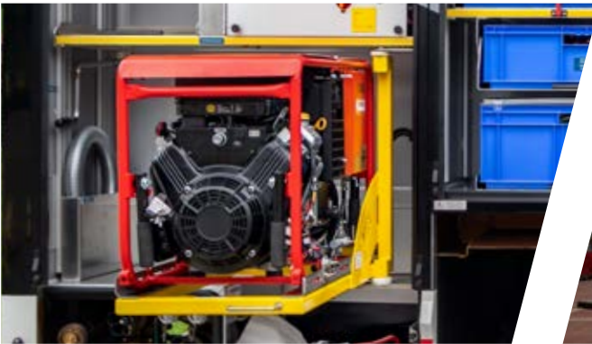
Drehwand mit Stromerzeuger in G6 Swing-out wall with generator in storage room G6