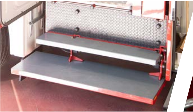
Pneumatisch ausklappbare Trittstufen, variabel ausführbar Pneumatic fold-out step, configured variably