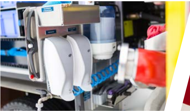
Hygieneboard auf Auszug Pull-out hygienic board