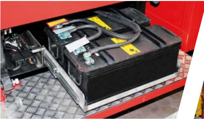
Batterien auf Edelstahlauszug hinter Trittstufen Batteries behind the fold-out step on a stainless steel extension