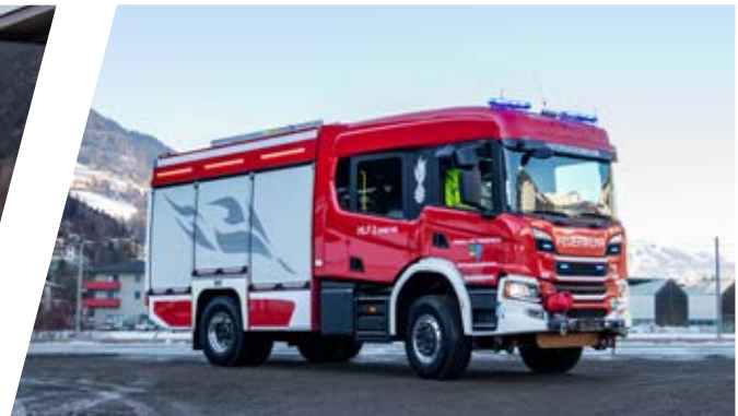
Hilfeleistungslöschgruppenfahrzeug, HLF 3 Rescue Assistance Vehicle