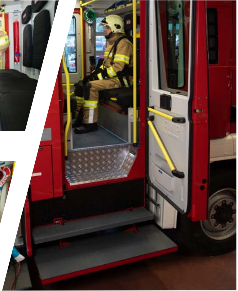
pneumatisch abklappbare Auftritte pneumatically folding access step