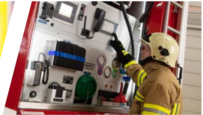
Ergonomisch bedienbare Pumpensteuerung nach Kundenwunsch Pump control / ergonomic operation