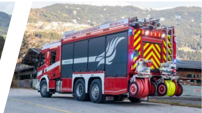
Hilfeleistungslöschgruppenfahrzeug, HLF Rescue Assistance Vehicle