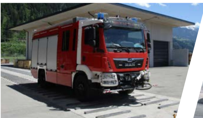
Rütteltest Vibration test