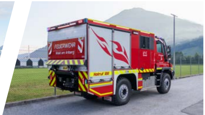
Löschfahrzeug mit Roll-Container, LF-C Pumper with roll-on container

„Perfekte Lösung für Ihre Herausforderung“ „Perfect solution for your challenge“