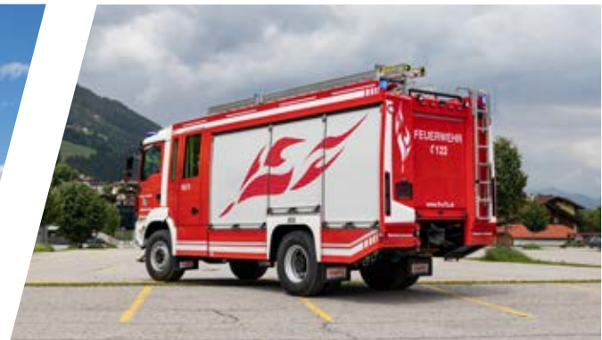
Hilfeleistungslöschgruppenfahrzeug, HLF 3 Rescue Assistance Vehicle