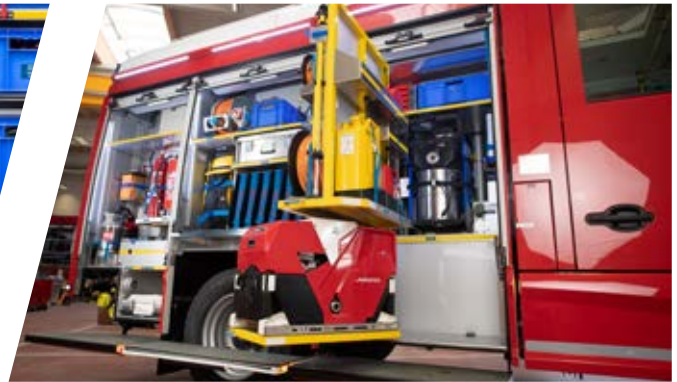
Drehwände variabel, getrennt oder durchgehend Swing-out walls