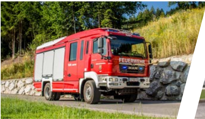
Tanklöschfahrzeug, TLF-A 2000/100 Pumper, TLF-A 2000/100