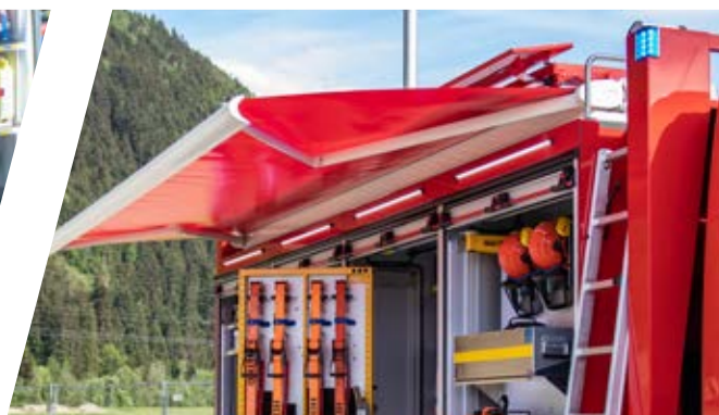
Ausfahrbare Markise Extendable awning