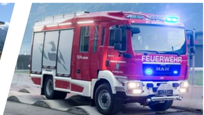
Verwindungstest Torsion test