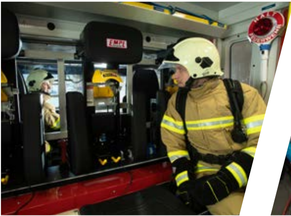
großzügige Kommunikationsöffnung generously sized communication opening