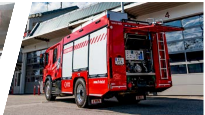
Rüstlöschfahrzeug, RLF Rescue equipment Vehicle with water tank