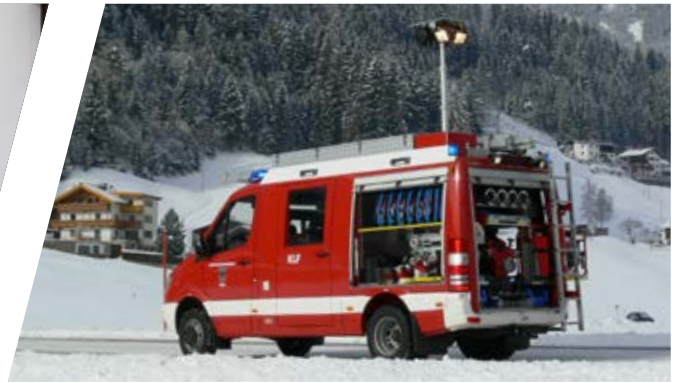
Kleinlöschfahrzeug, KLF Small Pumper