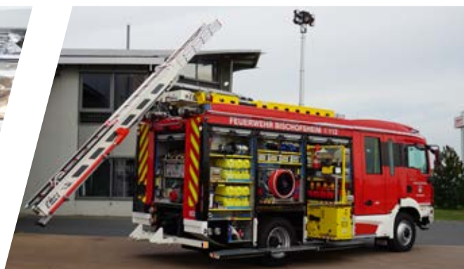
Mechanisch oder elektrische Leiterabsenkung Ladder lowering device, mechanical or electrical