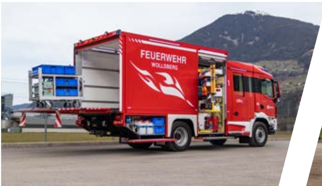
Löschfahrzeug, LF Pumper