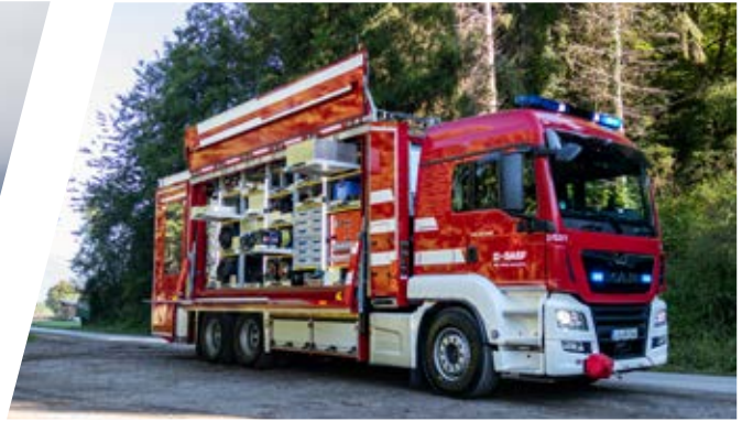
Rüstwagen, RW Rescue Vehicle