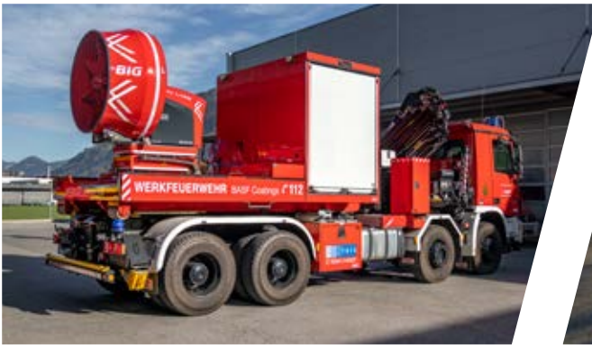
Abrollbehälter mit Groß-Raum-Lüfter Roll-off container with ventilator