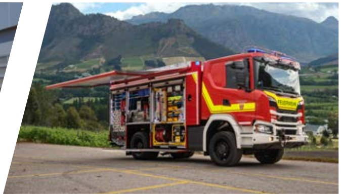
Rüstwagen, RW Rescue Vehicle