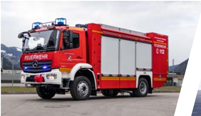
Rüstwagen, RW Rescue Vehicle