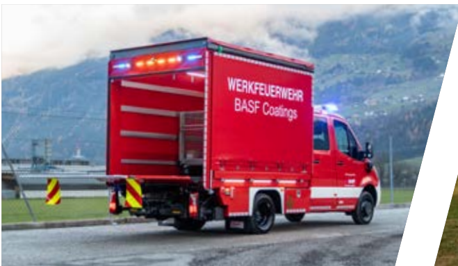
Gerätewagen, GW-L Support Vehicle