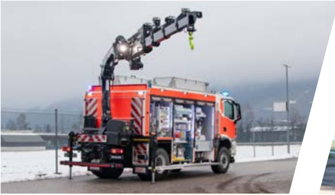
Rüstwagen mit Kran, RW-K Rescue Vehicle with crane