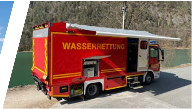
Gerätewagen, GW Support Vehicle