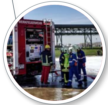
Abnahme und Einschulung mit dem Kunden Acceptance and training with the customer