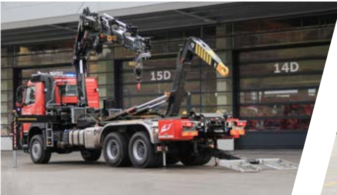
Wechseladefahrzeug mit Kran, WLF-K Hook Loading System with crane