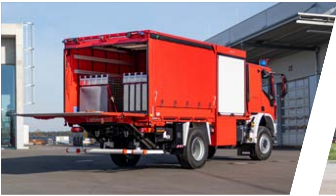
Gerätewagen, GW Support Vehicle