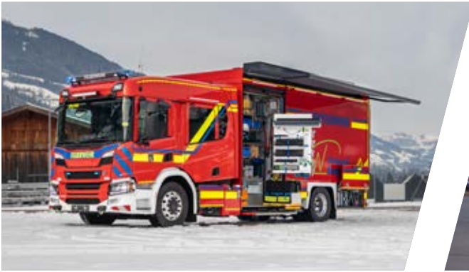
Gerätewagen, GW-L Support Vehicle