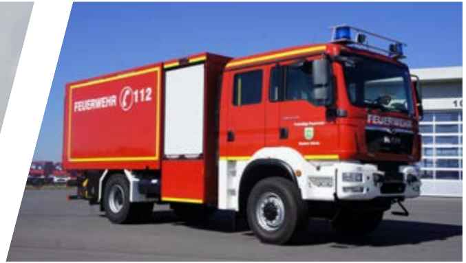
Gerätewagen, GW-L Support Vehicle