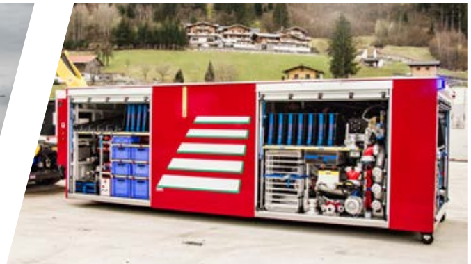
Abrollbehälter Wasser / Schaum Roll-off container water / foam