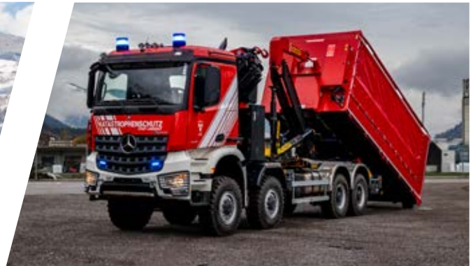
Wechseladefahrzeug mit Kran, WLF-K Hook Loading System with crane