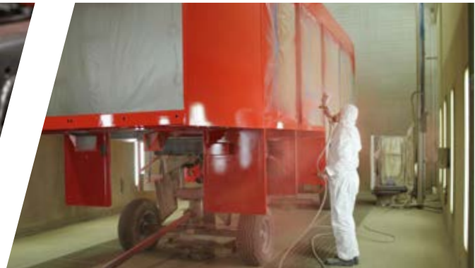
Hochwertige Aufbaulackierung High-quality body coating