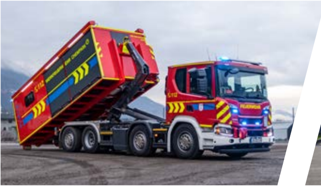
Wechseladefahrzeug, WLF Hook Loading System