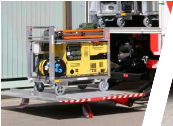
Rollcontainer mit Generator Roll-on containers with generator