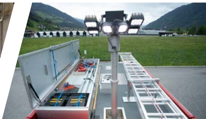
Lichtmast EMPL Function Light Lightmast EMPL Function Light