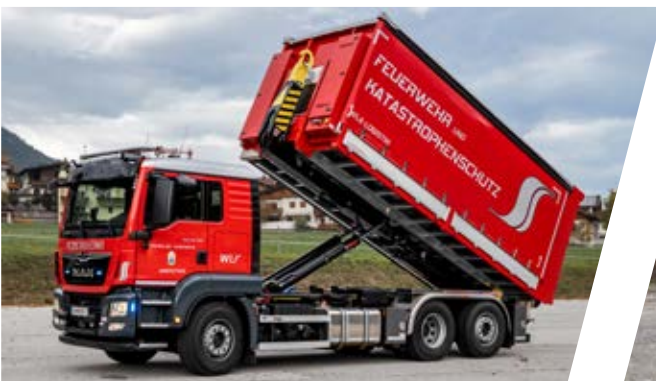
Wechseladefahrzeug, WLF Hook Loading System