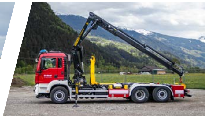
Wechseladefahrzeug mit Kran, WLF-K Hook Loading System with crane