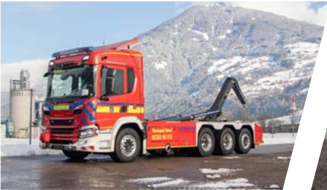
Wechseladefahrzeug, WLF Hook Loading System