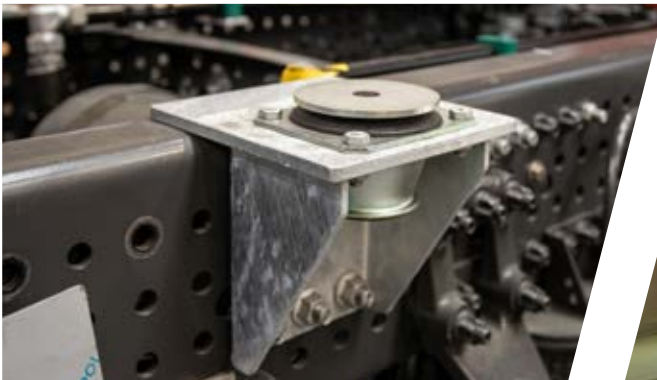
Lagerungskonsole Aufbau Supporting point for the body

We conserve both your body and also the chassis in a 2-layer process to military standard.