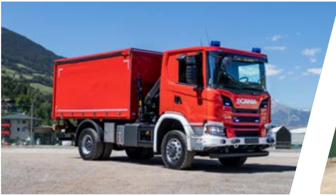
Gerätewagen, GW Support Vehicle