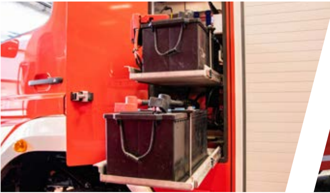
Batterien seitlich hinter dem Fahrerhaus eingebaut Batteries behind the drivers cab