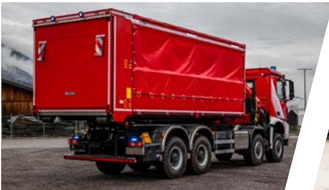
Abrollbehälter mit Ladebordwand Roll-off container with tail lift