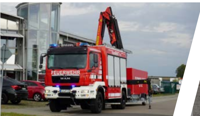
Rüstwagen mit Kran, RW-K Rescue Vehicle with crane