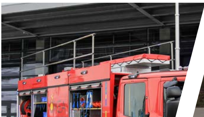
Dachgeländer Roof railing