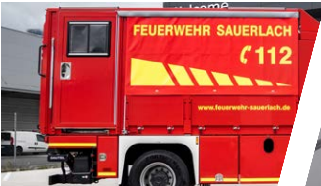
Seitlicher Türeinbau Side door