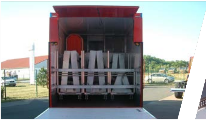
Sicherheitsverriegelung für den Rollcontainer-Transport Safety interlock for transport of roll-on containers