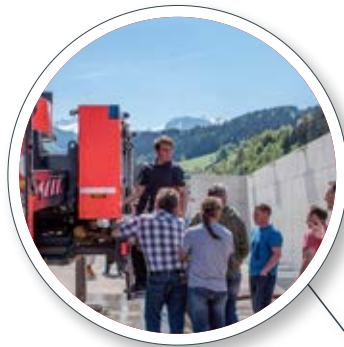
Schulung am Kundenstandort Training at the customer's site