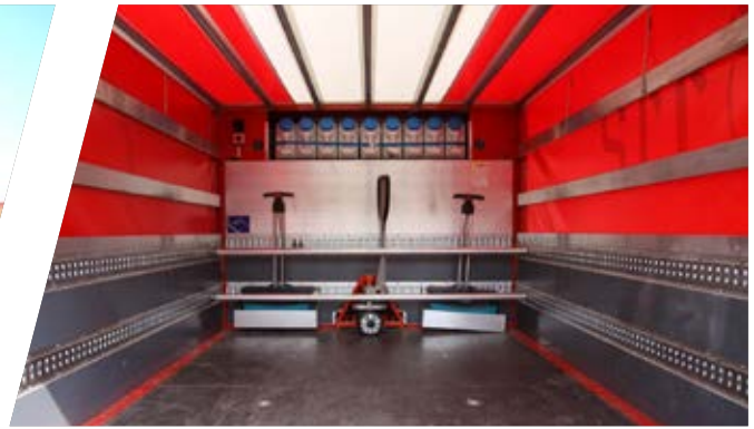
Hintere Gerätehalterung für individuelles Kundenzubehör Mountings for individual devices