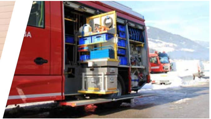
Drehwände Rotating shelves