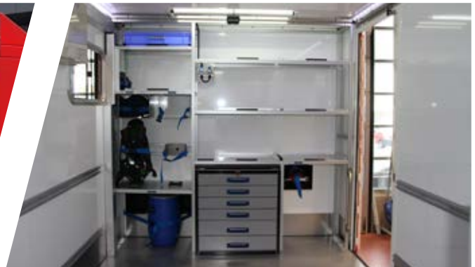
Kundenspezifischer Innenausbau Customised interior construction