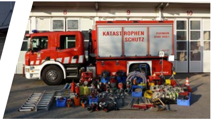
Abrollbehälter Katastrophenschutz Roll-off container for disaster management