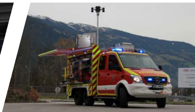
Ausfahrbare Markise Extendable awning