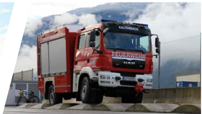
Verwindungstest Torsion test