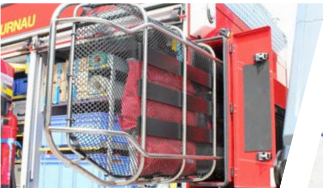
Rettungstrage für Bergereinsätze Stretcher for rescue operations