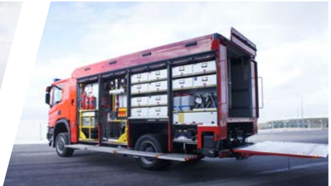
Rüstwagen, RW Rescue Vehicle