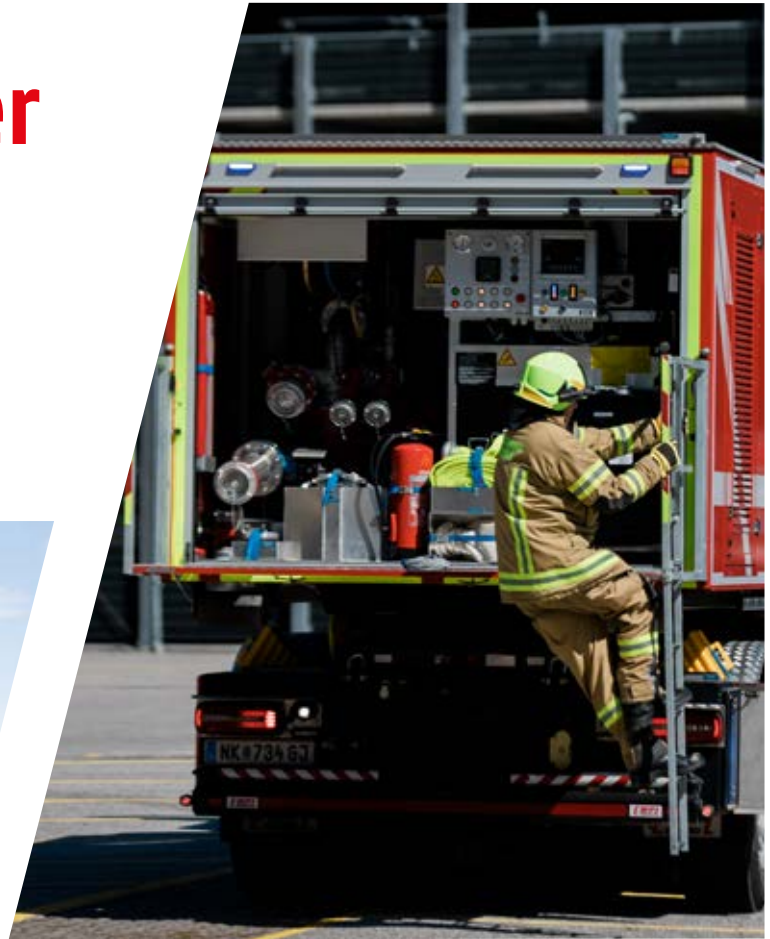
Abrollbehälter mit Wasser / Schaum Tank Roll-off container with water / foam tank