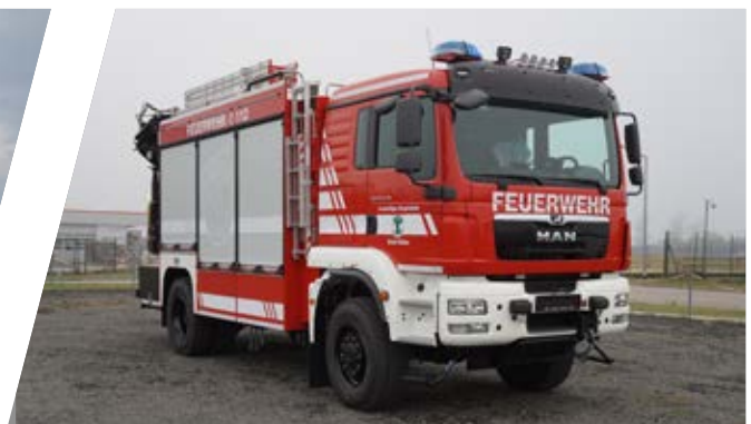
Rüstwagen mit Kran, RW-K Rescue Vehicle with crane