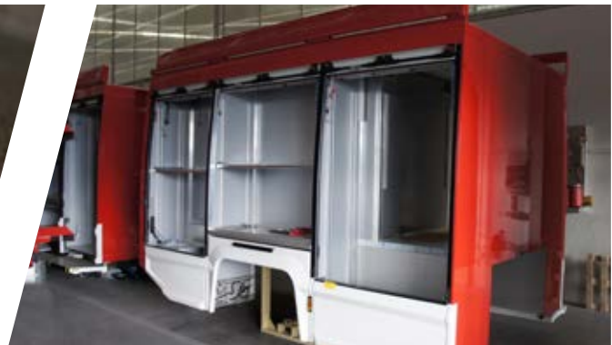
Aufbau aus kunststoffbeschichteten Aluminium Sandwich-Paneelen Body made of aluminium sandwich panels