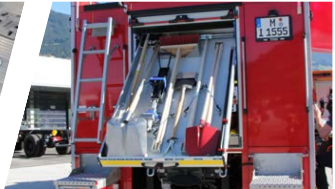
Individueller Heckauszug Individual rear extension