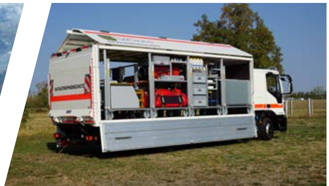
Gerätewagen für Katastrophenschutz, GW-KatS Support Vehicle for disaster management