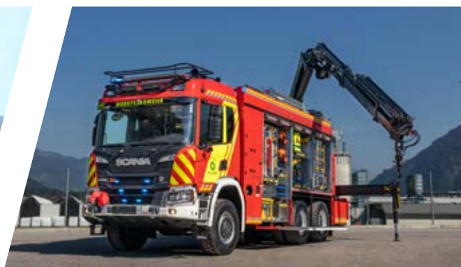
Heckkran Rear crane