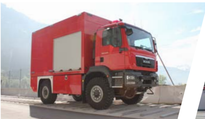
Rütteltest Vibration test