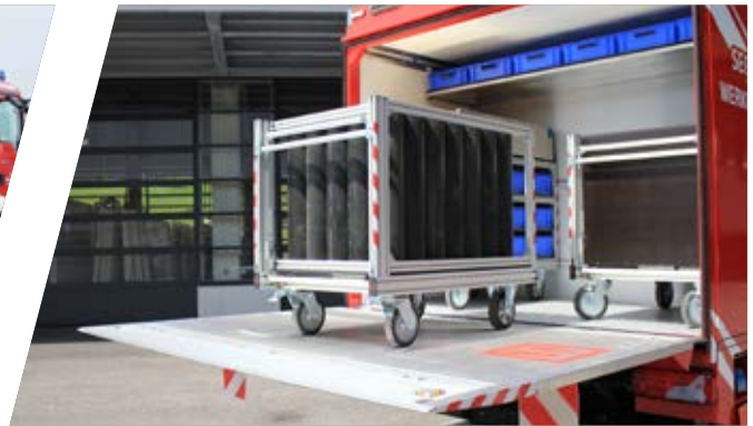
Platzsparende Rollcontainer-Variante Space-saving version of a roll-on container