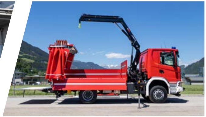
Gerätewagen, GW Support Vehicle