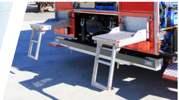
Variable Aufstiegsstufen Individual access steps