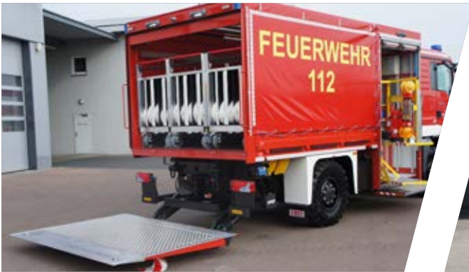
Optimale Raumnutzung durch maßgeschneiderte Rollcontainer Custom-made roll-on containers for an ideal use of space