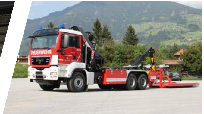
Wechseladefahrzeug mit Kran, WLF-K Hook Loading System with crane