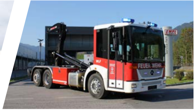
Wechseladefahrzeug, WLF Hook Loading System