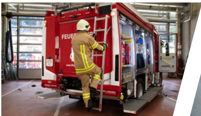
Selbstarretierende Heckaufstiegsleiter mit Schrägstellung Self-locking rear ladder held in a slant position