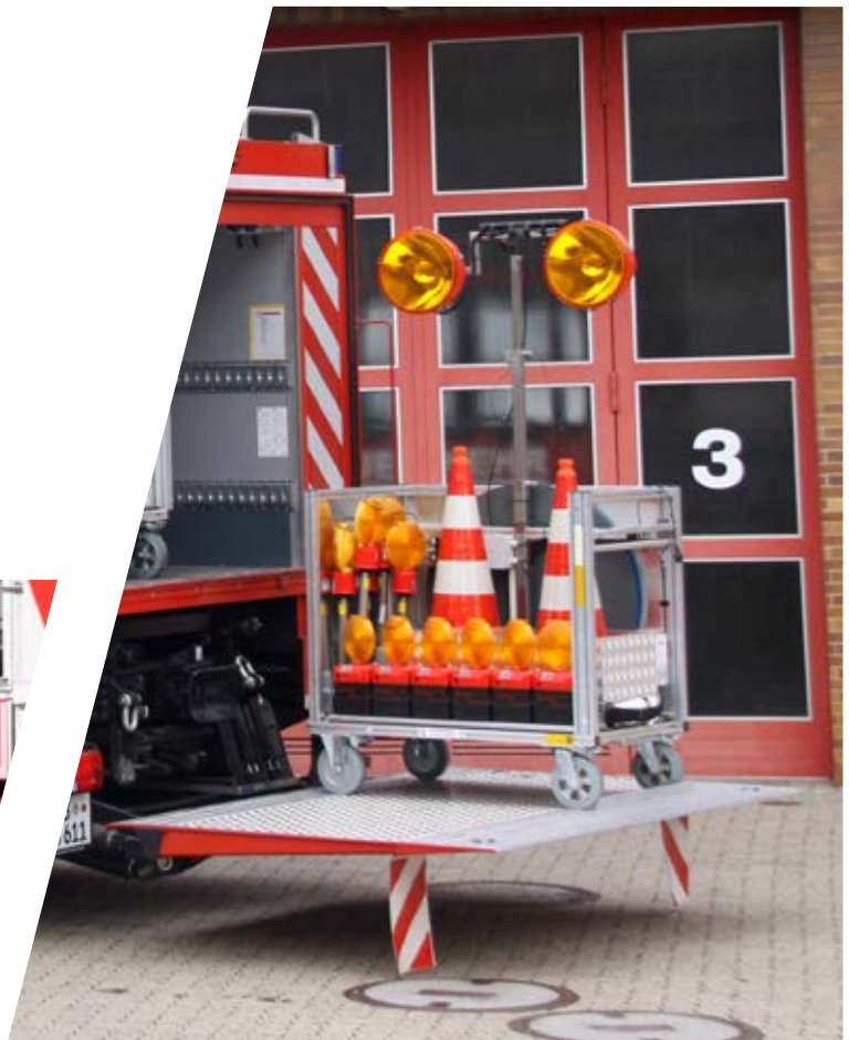
Rollcontainer mit Verkehrsleitsystem Roll-on containers with traffic control system