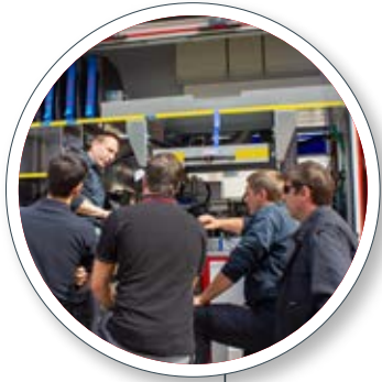
Rohbaubesprechung Intermediate manufacture meeting