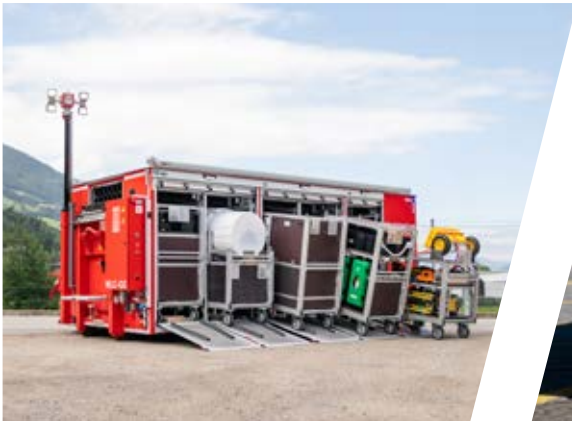
Abrollbehälter Logistik Roll-off container logistic