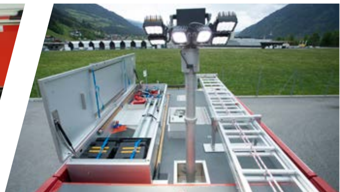
Begehbare Aufbau- und Kabinendach Walk-on body and compartment roof