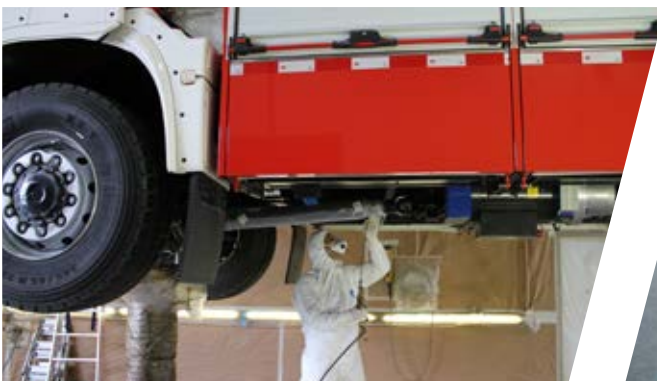
Langanhaltender Schutz durch professionelle Konservierung Durable protection due to professional conservation