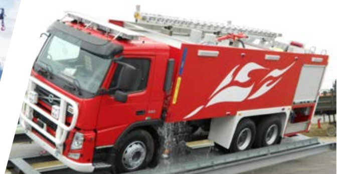
Kipptest Tipping test