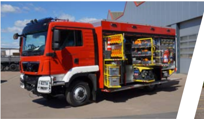
Rüstwagen, RW Rescue Vehicle