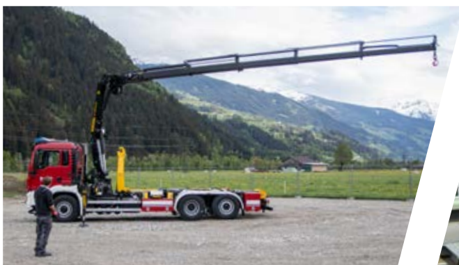
Kraneinstellung Crane setting