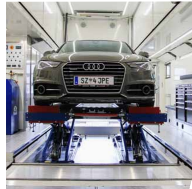
Hebebühne mit integrierter Rüttelplatte Vehicle lift with integrated vibration plate

The mobile test station enables professional working on a limited footprint. The integrated test section, equipped with brake test stand, shock absorber test system, vehicle lift, vibration plate, headlamp adjustment tester and state-of-the-art testing, diagnostics and fault read-out units, allows a variety of technical checks for statutory vehicle testing.