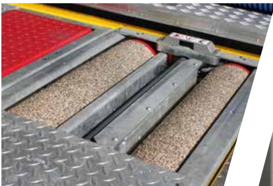
Bremsenprüfstand Brake test stand