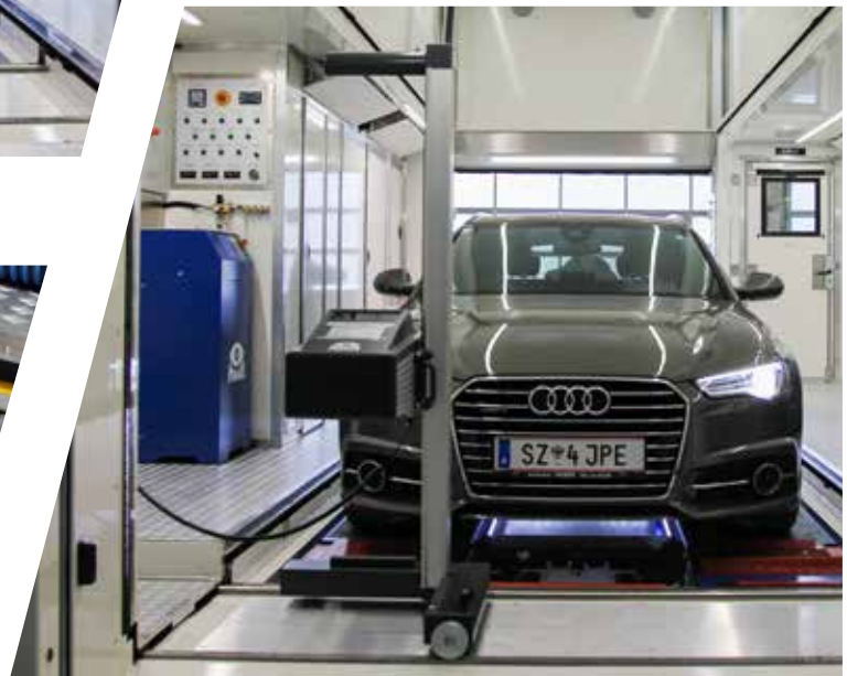
Scheinwerfereinstellprüfgerät Headlamp adjustment tester