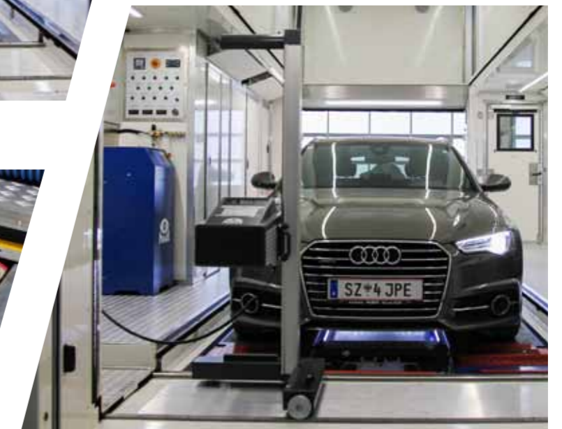
Scheinwerfereinstellprüfgerät Headlamp adjustment tester