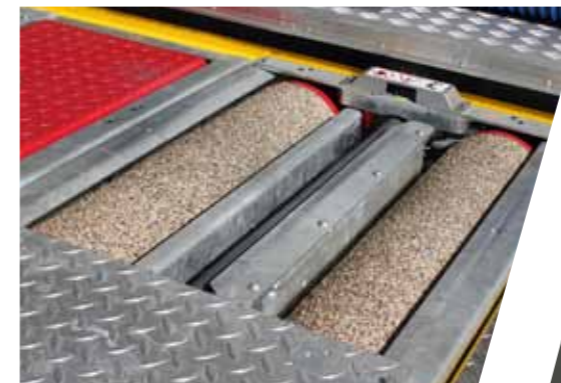
Bremsenprüfstand Brake test stand